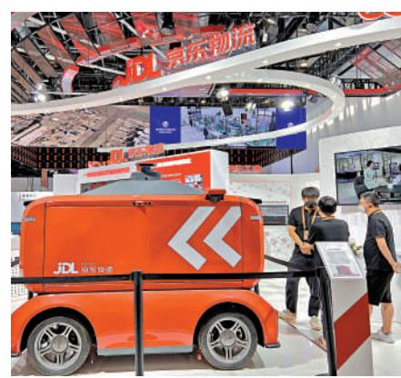
淡馬錫上季大手增持京東，持股增加4.4倍。

不過，淡馬錫上季可能悉數減持所有滴滴出行股份，因為文件並無顯示淡馬錫持有滴滴出行股份。淡馬錫去年第三季刊列持有滴滴出行3003萬股。另外，淡馬錫對阿里巴巴(09988)、拼多多、百勝中國(09987)持倉並無變化。