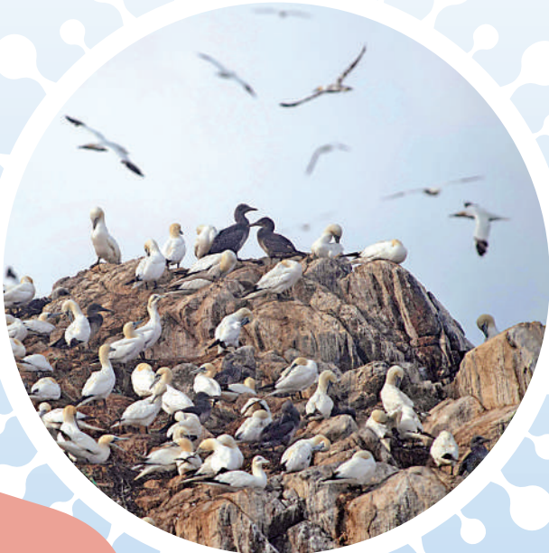
野鳥將禽流病毒傳染給家禽和哺乳動物。資料圖片

【大公報訊】綜合CNN、德國之聲、路透社報道：H5N1型禽流疫情在全球範圍蔓延，南美國家阿根廷和烏拉圭15日首次發現禽流確診病例，分別進入全國衛生緊急狀態，世界最大雞肉出口國巴西亦提高警惕。今年1月以來，秘魯海灘上超過600頭海獅感染禽流死亡，專家擔憂病毒可能已在哺乳動物之間傳播，若繼續變異恐對人類構成威脅。世界衛生組織日前表示，禽流病毒傳播給類人的風險依然很低，但「不能假設情況會一直如此」。