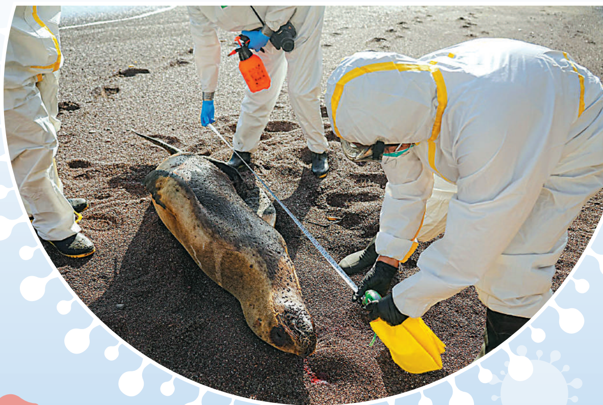
科學家1月25日在秘魯海灘上檢查病死海獅的屍體。