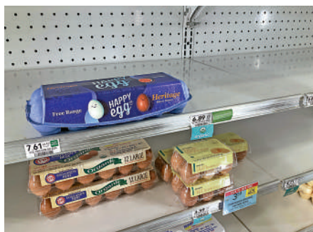
▲美國撲殺大量蛋雞，導致雞蛋供應減少，價格飆升。

導致蛋價飛漲。今年1月，美國國內市場蛋價環比上漲8.5%，同比上漲逾70%，創50年新高。據彭博社報道，一打雞蛋（12個）的價格已升至4.82美元（約38港元），而一磅免治牛肉只要4.64美元。由於雞蛋、果汁等早餐食品價格飆升，美媒建議，為了省錢，美國人可以考慮不吃早餐。