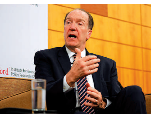
▲馬爾帕斯將在6月底之前辭去世銀行長一職。資料圖片

等人類活動導致全球變暖。白宮新聞秘書讓一皮埃爾稱，白宮譴責馬爾帕斯上述言論，本月9日，耶倫強調，包括世銀在內的多邊金融機構採取堅決行動應對氣候變化等全球挑戰至關重要。