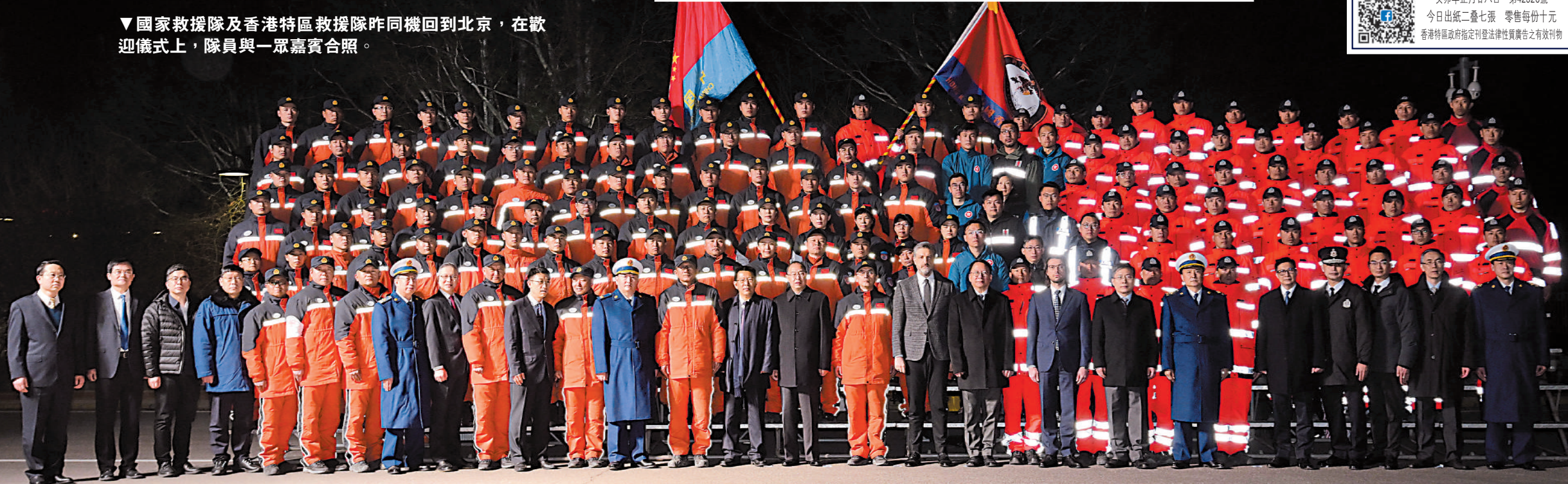
▼國家救援隊及香港特區救援隊昨同機回到北京，在歡迎儀式上，隊員與一眾嘉賓合照。