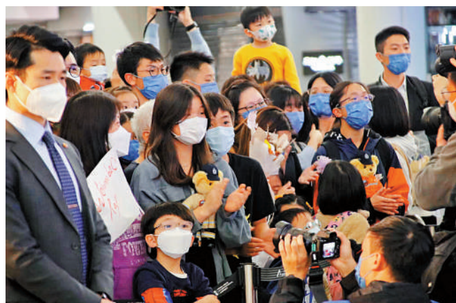
▲昨晚香港特區救援隊抵港，在機場等候的市民熱烈鼓掌歡迎。