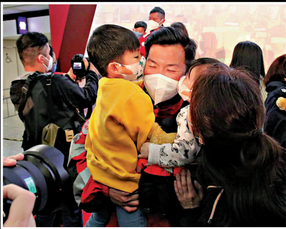
擁吻 返港的救援隊員獲家人親吻。