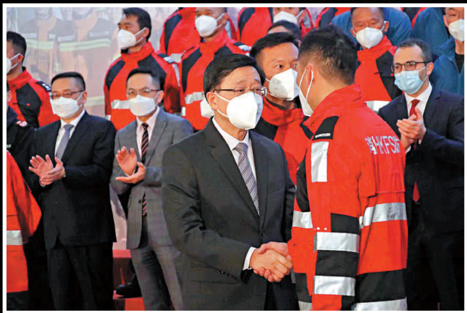
勉勵 行政長官李家超昨夜到機場出席迎接儀式，並與救援隊隊員親切握手。