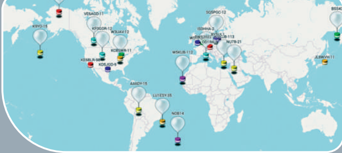
▲美國或出動軍機擊落民用氣球，足見其風聲鶴唳。伊利諾伊州「苦主」氣球俱樂部發布的圖片顯示他們的氣球遍布全球。