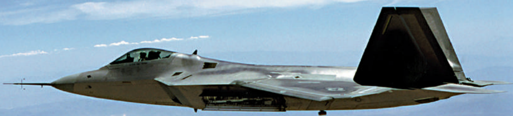
▲美軍F-22戰機11日在阿拉斯加上空擊落的可能是業餘愛好者俱樂部的氣球。設計圖片

失控的氣球只是影響百姓的一時情緒，但失控的中美關係將會把世界拖入災難，這是中方最不希望看到的。希望美國真正把「管控中競爭」落到實處，否則拜登重複一千遍「美國不尋求與中國衝突」依舊是個謊言。