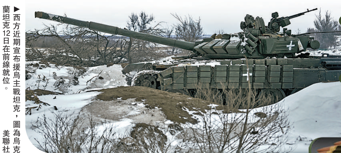
▶西方近期宣布援烏主戰坦克，圖為烏克蘭12日在前線就位。