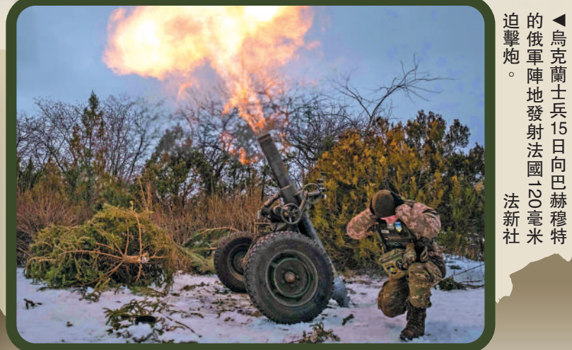
◀烏克蘭士兵15日向巴赫穆特的俄軍陣地發射法國155毫米榴彈炮。