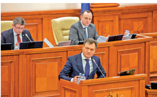
▶摩爾多瓦新總理雷切安（前排）16日宣誓就職，圖為他向議會發表講話。

摩爾多瓦人口250萬，與烏克蘭和羅馬尼亞接壤，該國經濟高度依賴俄羅斯天然氣，已深受俄烏衝突外溢效應衝擊。去年在收容大量烏克蘭難民之際，摩爾多瓦能源與食品價格高漲，推升通貨膨脹，引發反政府抗議。摩爾多瓦曾是前蘇聯加盟國，但在近年轉向西方，俄羅斯仍在摩爾多瓦德涅斯特河沿岸部分地區保留少量駐軍。