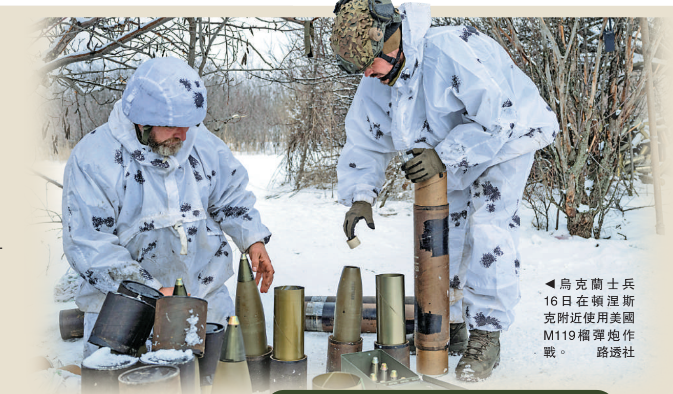
◀烏克蘭士兵16日在頓涅斯克附近使用美國M119榴彈炮作戰。