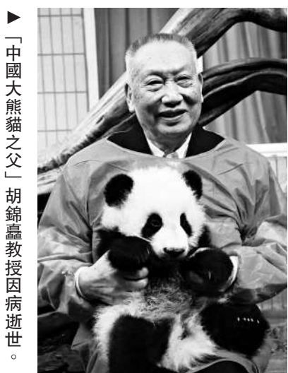
「中國大熊貓之父」胡錦轟教授因病逝世。

【大公報訊】記者向芸成都報道：2月16日晚間，世界著名的大熊貓研究專家、國際公認的大熊貓生態生物學研究奠基人、被譽為「中國大熊貓研究第一人」「中國大熊貓之父」的胡錦轟教授因病逝世，享年94歲。作為我國大熊貓野外研究及保護事業的開拓者，他創造了多個「第一」或「首次」，並促成5個國家級自然保護區的建立，使大熊貓等多種珍稀瀕危動物得到了有效拯救。 儘管現在大熊貓「風靡」世界，但其實人類對牠的系統認識僅有幾十年。上世紀七十年代初，世界掀起「熊貓熱」。作為唯一擁有大熊貓的國家，中國對「國寶」的分布、數量等情況卻不甚了解。1973年，國務院召集川、陝、甘三省大熊貓產區召開座談會，決定弄清野生大熊貓的真正數量。