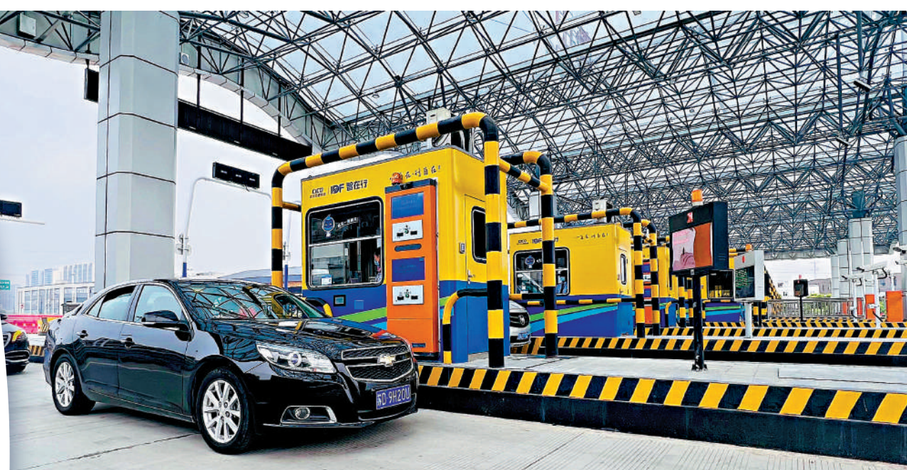
▲近日，一篇由ChatGPT創作的關於杭州3月1號取消限行的「新聞稿」引發熱議。圖為浙江滬杭甬高速公路蕭山收費站網絡圖片

公安部網安局還提到，在ChatGPT推出幾周後，不法分子對ChatGPT的惡意利用也帶來了更多的數據安全問題。目前外國已有相關機構證明，該機器人可能被用於編寫惡意軟件，從而逃避防病毒軟件的檢測，或利用其擬人的聊天對話能力，冒充真實的人或者組織騙取他人信息等。