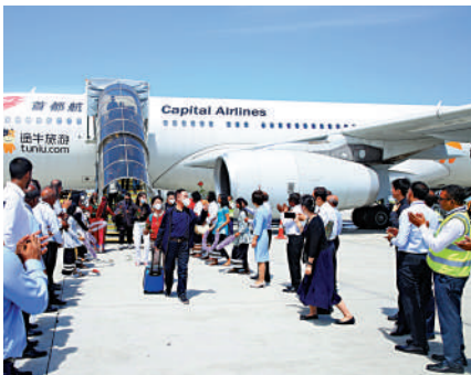
▲1月18日，乘坐中國首都航空JD455航班的遊客在馬爾代夫馬累維拉納國際機場受到歡迎。

16日，歐盟輪值主席國瑞典發布聲明稱，神根成員國已經同意，即日起逐步取消針對自中國出發旅客的入境防疫要求。 世界旅遊城市聯合會執行主任兼公共關係與品牌推廣部總監才華17日對大公報說，中國遊客出境旅遊，能帶來三方面積極影響：第一，中國遊客的購買力對於旅遊目的地而言極具誘惑力，能促進國際商貿往來。第二，中國遊客走出去之後，會有助於增進國際社會對中國的了解。第三，中國遊客出境遊，還能夠促進國際間的文化交流與民心相通，增進世界各國人民間的友誼。