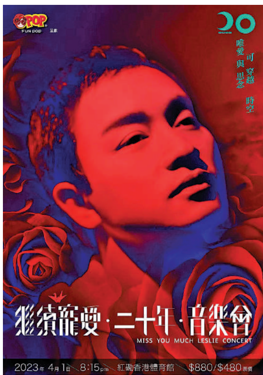
▲「繼續寵愛·二十年·音樂會」海報。

【大公報訊】記者顏珉報導：為紀念「哥哥」張國榮離世20周年，天星娛樂有限公司昨天舉行記者會，宣布將於4月1日在紅磡體育館舉辦「繼續寵愛·二十年·音樂會」，門票由2月22日起於城市售票網公開發售，而早前於「哥」迷會網站作優先訂票，迅速售罄。