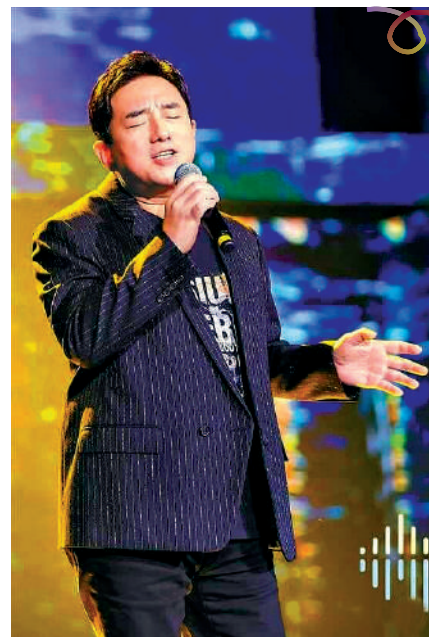
▶呂方曾經參加內地歌唱節目《我們的歌》。