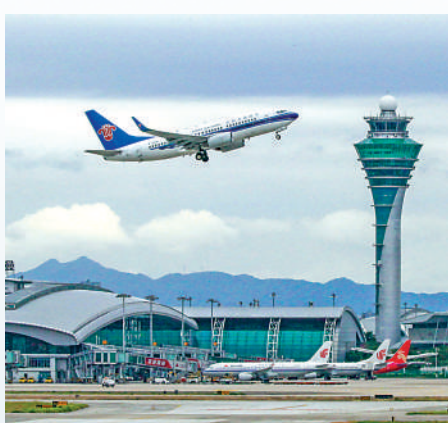
▲圖為廣州白雲機場。

以廣州白雲機場、深圳寶安機場、香港國際機場三大國際航空樞紐為引領的世界級機場群正迅速崛起。預計到2035年，粵港澳大灣區將擁有7座運輸機場、17條跑道，旅客吞吐量達4.2億人