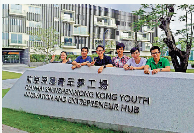
▲前海深港青年夢工場吸引更多創新創業人才來大灣區發展。

備受期待的香港故宮文化博物館於2022年7月3日正式向公眾開放。展出從故宮博物院藏品中精選出來的逾900餘件珍貴文物，其中包括166件國家一級文物。在香港回歸祖國25周年之際，為廣大香港市民送上了一份厚禮。