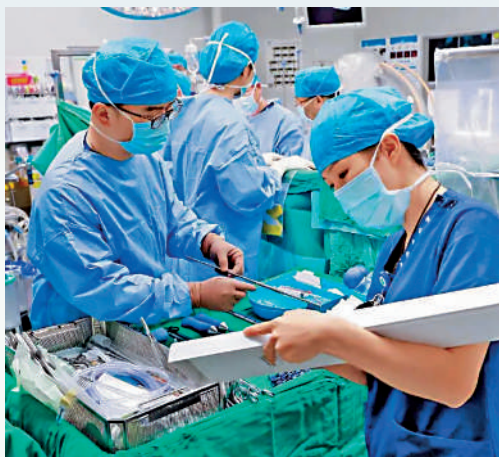
▲港大深圳醫院是「港澳藥械通」政策先期試點醫院。

穩妥推進「港澳藥械通」，開展港澳外用中成藥審評審批、港澳藥品醫療器械在大灣區內地生產等工作，是灣區藥械監管創新發展的重要措施。