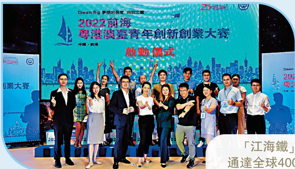
前海粵港澳青年創新創業大賽「幫助更多港青就業創業」。