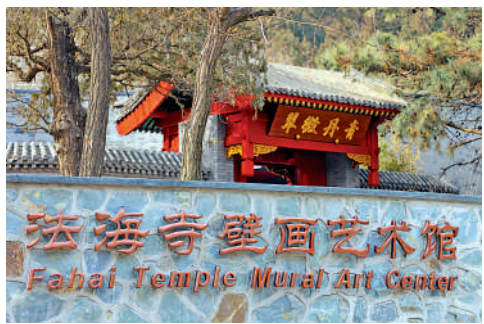
▲近日，法海寺壁畫藝術館開館試運行。