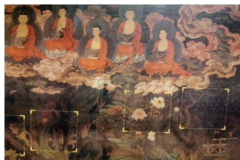
▲法海寺壁畫共繪有77個人物，佛神菩薩、諸神侍衛、鳥獸坐騎，神情生動、姿態各異，圖為展示部分細節。