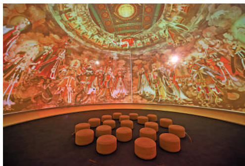
▲展廳內設有一座360度全環繞的球幕影院，介紹法海寺建寺歷史。

法海寺的壁畫歷經近600年，今天依然絢麗多彩。據中國美術家協會綜合材料繪畫藝術委員會副主任王書傑介紹，法海寺壁畫所用顏料來源於石青、石綠、赭石、朱砂等純天然礦物色，經過特殊技法加工形成，使這些顏色既不怕風吹也不怕日曬，相對比較穩定。在壁畫繪製上，法海寺還採用了疊暈烘染的上色技巧，有些部位甚至達到了7層之