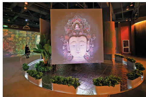
▲法海寺壁畫藝術館展覽現場。