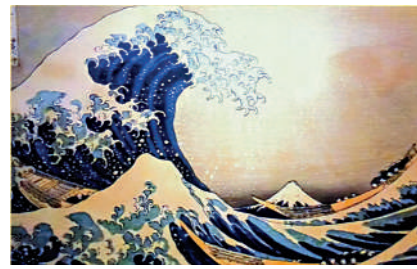
◀▶日本19世紀的浮世繪作品《神奈川衝浪裏》(左)中海浪的畫法，與《佛眾赴會圖》(右)的繪畫風格有異曲同工之妙。

法海寺壁畫也見證了中國繪畫對日本的影響。對比可以看出，日本19世紀的浮世繪作品《神奈川衝浪裏》中海浪的畫法，與《佛眾赴會圖》中的繪畫風格有異曲同工之妙。這是由於從江戶時期，日本關東地區的知識分子開始嘗試稱為「關東南畫」的新中國畫風，其特色就是傾向於結合明清畫風的各種技法，特別是糅合了浙派畫風。