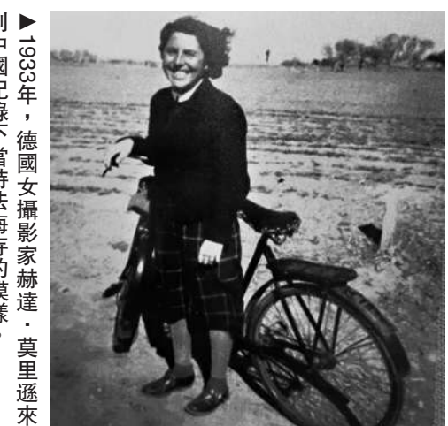
▶1903年，德國女攝影家赫達·莫里遜來到中國記錄下當時法海寺的模樣。