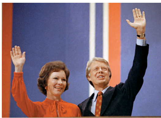
▲1976年，卡特成為民主黨總統候選人。

1979年1月25日，卡特接受了一家中國電視台的採訪，對着鏡頭告訴億萬中國觀眾：中美長達30年的隔閡已經消除，兩國建交為加強經貿、文化、科技等各领域合作提供了契