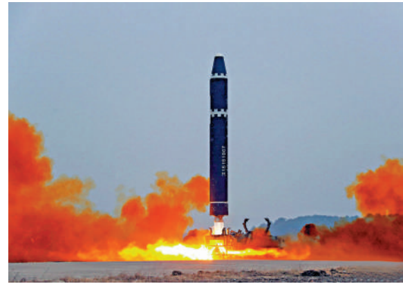
▲朝鮮官媒公布發射「火星-15」型導彈的照片。

副部長金正恩19日發表談話，抨擊美國和韓國打着應對威脅的招牌大肆叫囂擴張遏制力。金正恩警告，朝方將密切關注敵人的一舉一動，並將做出「與之相應的、強有力的壓倒性應對」。