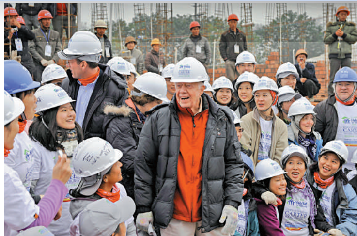
▲卡特卸任後多次訪華，圖為他2009年到訪中國四川省。

【大公報訊】綜合《紐約時報》、BBC、美國之音報導：非營利性基金會卡特中心18日發表聲明說，98歲高齡的美國前總統吉米·卡特在經過一系列短期住院治療後，決定在家中接受臨終關懷（又稱寧養照顧），與家人共度生命的最後時日。卡特於1977年至1981年出任美國第39任總統，在其任內中美兩國正式建立外交關係，卸任後繼續推動中美交流合作。然而，他簽署的《與台灣關係法》為中美關係留下後患。