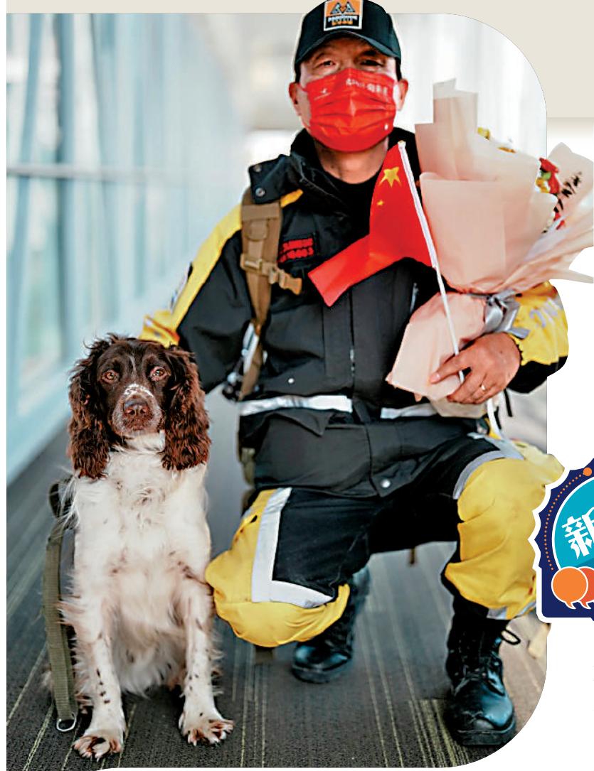
▲Lucky完成任務，與隊員一起凱旋歸來。