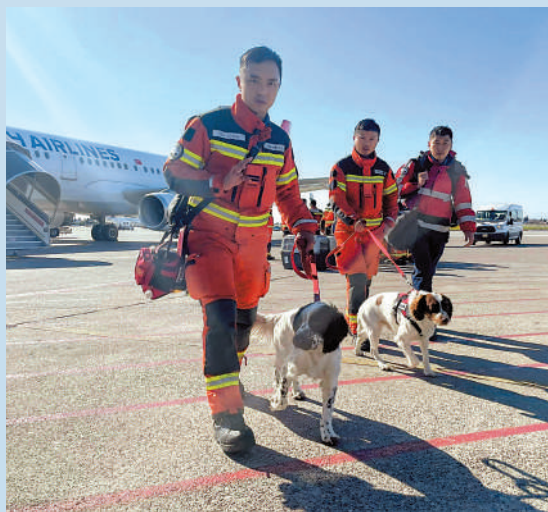
▲香港消防搜索犬Umi（左）及Twix（右）。

Umi及Twix按入境檢疫要求，現時在消防學院院舍內進行隔離，直至狂犬病檢驗報告正常，便可再投入工作。