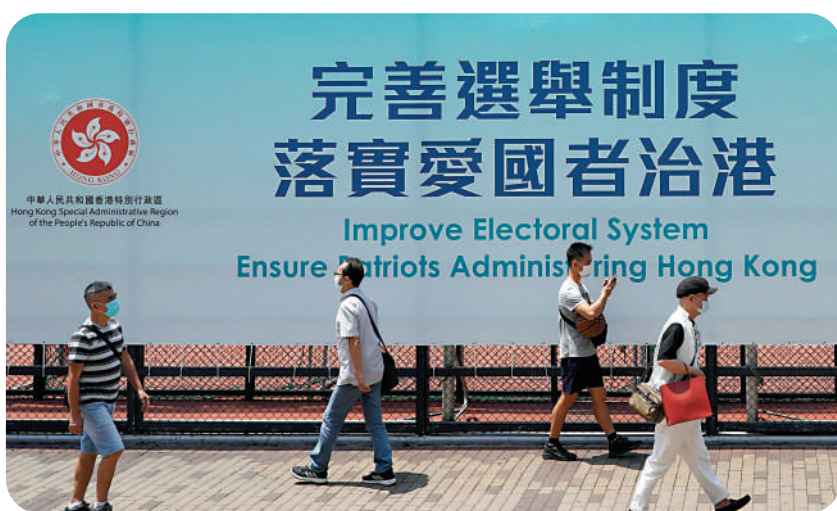
◀愛國者必然會自覺維護國家主權、安全及香港的發展利益。