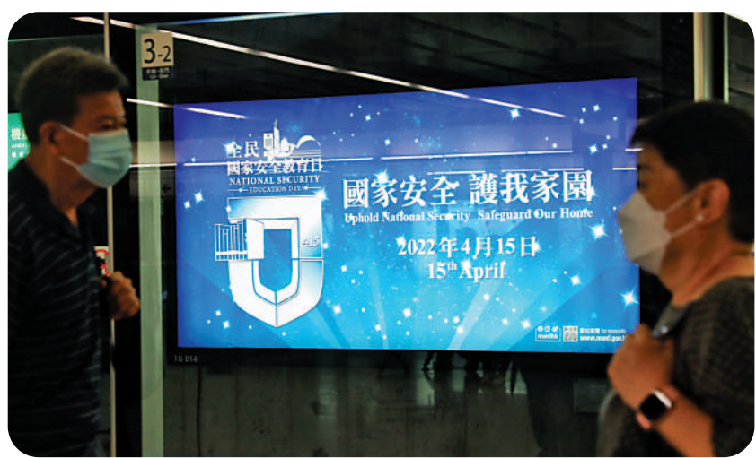
▶落實「愛國者治港」，對於香港實踐「一國兩制」、港人治港、高度自治具有重大深遠意義。