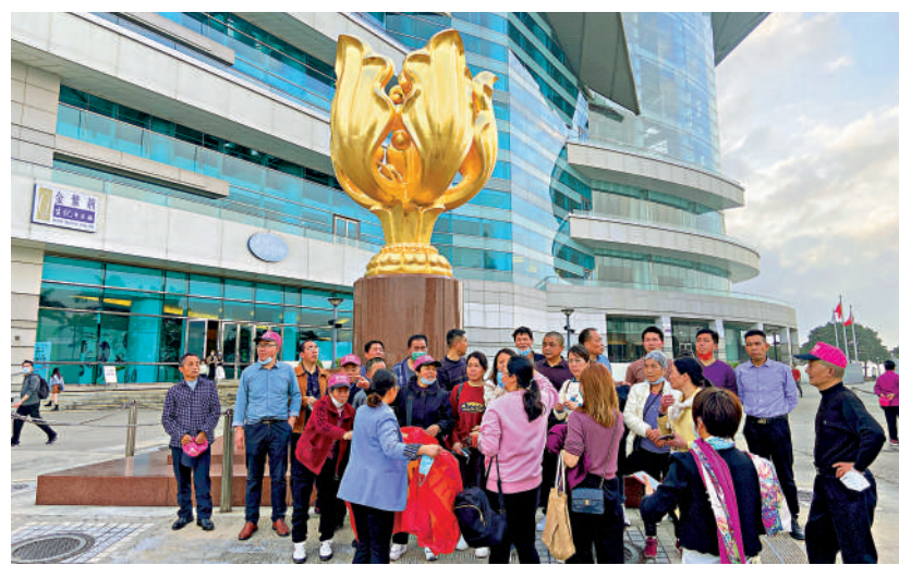
▶政府注資3000萬元「旅行社資訊科技發展配對基金計劃」，鼓勵業界升級轉型，為旅客提供更好的旅遊體驗。

自由黨支持政府再派發5000元電子消費券，認為對各界都有很大幫助，並建議盡快在上半年完成發放5000元，指下半年香港應該會有更多旅客來港，各界可「自力更生」。對於政府建議即時將每支香煙的煙草稅調高6毫，自由黨擔心加稅只會令私煙問題惡化，認為透過加強教育及宣傳才是正確方向。