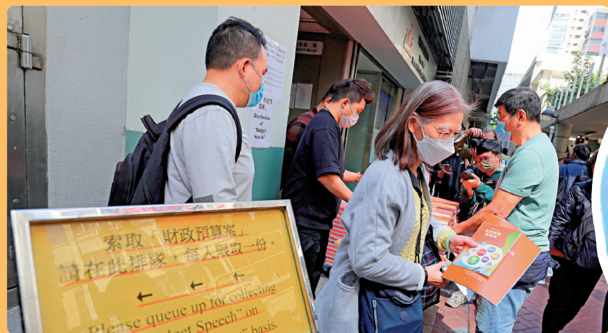
▲財政司司長陳茂波昨日公布新一份預算案，大批市民在各區民政事務處外排隊索取相關小冊子。