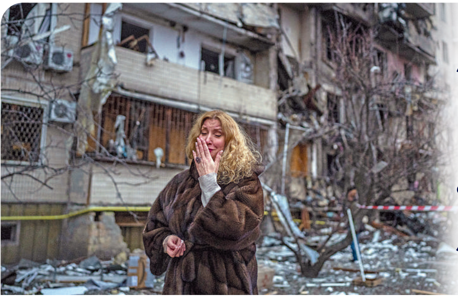
▶去年2月25日，基輔一棟民宅遭遇空襲，一名婦女掩面哭泣。

【大公報訊】綜合《紐約時報》、BBC、新華社報道：俄烏衝突滿一年之際，雙方動作頻頻。在美國主導下，北約持續向烏輸送武器裝備，不斷給這場危機火上澆油。分析指，從俄美領導人和高官近日表態判斷，雙方似乎都做好了在戰場長期對抗的準備。然而，這一年的戰爭不僅給俄烏帶來重大人員傷亡和軍事經濟損失，深入捲入的西方國家也陷入能源危機和通脹率高企等民生難題中。