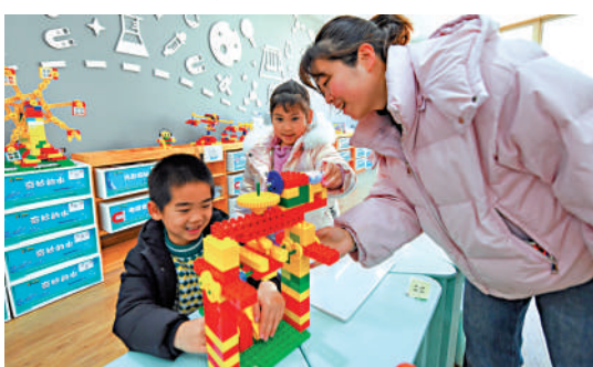
▲2月15日，江蘇常州一家幼兒園的小朋友們在老師指導下拼搭積木。

隨著社會的快速發展，青少年群體在學習、適應環境和人際關係等方面的壓力增大，青少年的心理健康亟需關注。在持續關注教育公平、「雙減」落地的同時，不少代表委員呼籲，有關部門進一步做深做實青少年心理健康教育，讓心理健康課程伴隨青少年學習成長全過程。