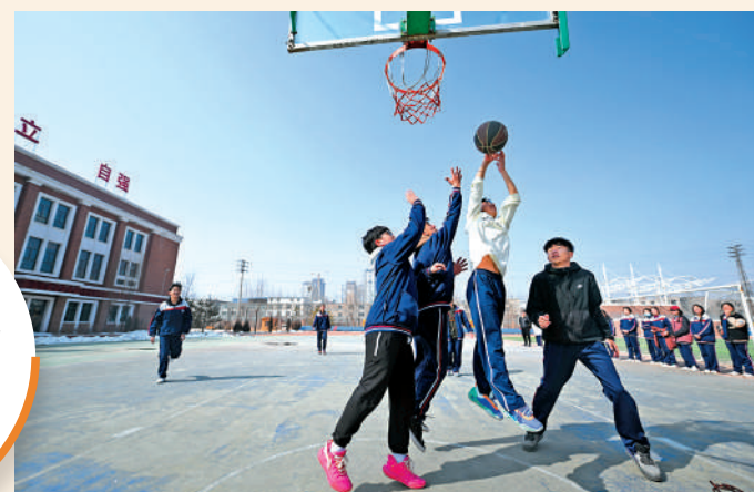
▲青海西寧樂洛中學學生在體育課上打籃球。

要進一步做深做實青少年心理健康教育，讓心理健康課程伴隨青少年學習成長全過程。同時，建議發揮兒科醫院專業優勢，設立青少年心理或精神疾病專業病房，及時發現、診斷、診療，讓青少年的生活及時回歸正常。