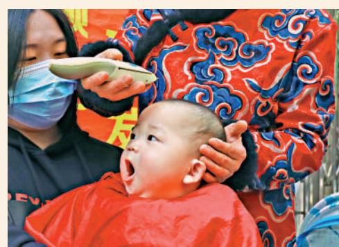
◀2月21日，江西南昌一名嬰兒正在理髮。

針對以往代表們提出的內地養老服務體系已有雛形但還未健全，政府、社會、市場和家庭責任邊界不明晰，存在服務設施、機構、人員和資金要素保障不到位、區域發展不平衡等問題，全國人大社會委近日建議，加快養老服務立法進程，條件成熟時，提請將制定養老服務法列入常委會年度立法工作計劃。