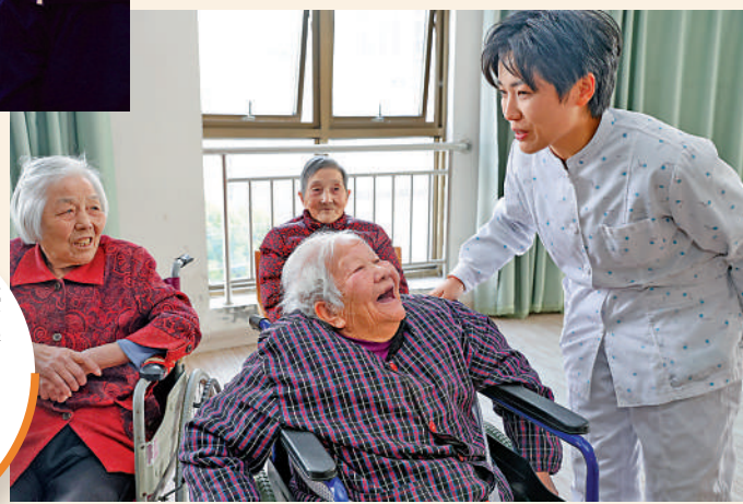
▲江蘇南通一家護理院職工和老人聊天。

各級政府可通過擴大供給、提升質量、優化結構等方式，有效滿足多層次多樣化養老需求；推進養老資源公共服務均等化水平，縮小城鄉、地域養老服務差異。同時，要引導各類市場主體參與養老服務行業。