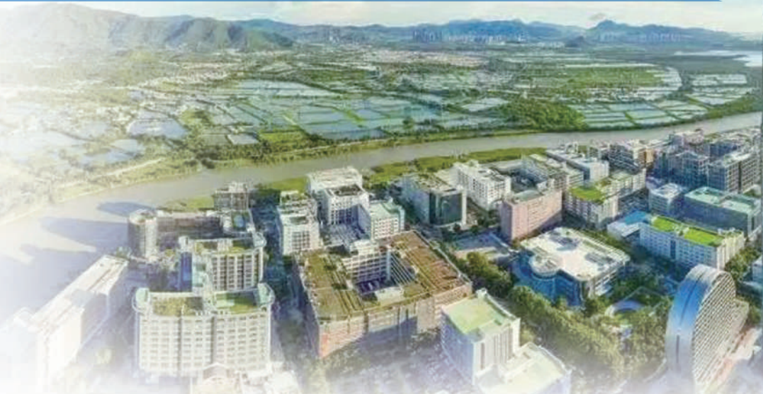
▲圖為深圳和香港落馬洲河套地區及周邊風光。

從深圳梧桐山牛尾嶺出發，蜿蜒曲折的深圳河一路向西，流過兩地正在合作開發中的河套深港科技創新合作區、前海深港現代服務業合作區、世界最大的國際會展中心，匯入伶仃洋。小河如同一道臍帶，連着深港兩地經濟總量加起來達6萬億的超級大都市。河水無言，見證了「滄海桑田變幻」的歷史，如今，兩座城市搭乘粵港澳大灣區建設的東風，攜手描繪深圳兩岸的美好畫卷。