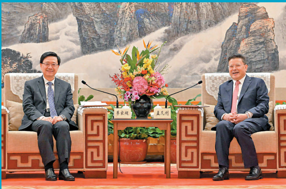
▲行政長官李家超與廣東省委副書記、深圳市委書記孟凡利（右）會面。