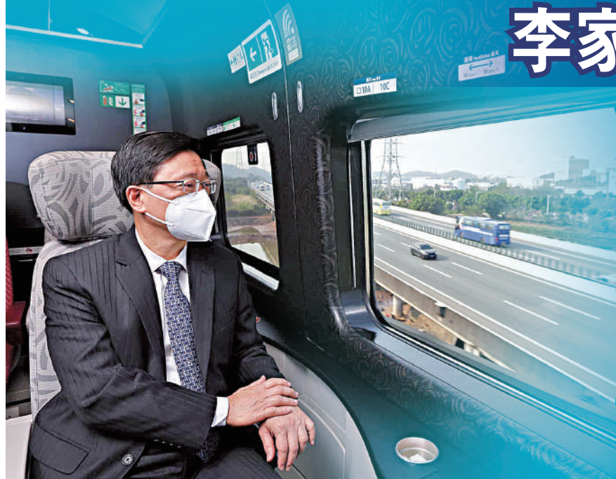
▲李家超與團隊乘坐高鐵到廣州，他表示高鐵出行正是大灣區「一小時生活圈」的象徵。