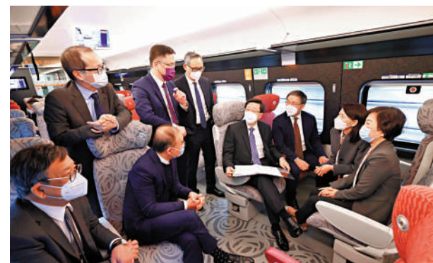
▲政務司副司長卓卓興及多名局長隨同特首李家超一同出訪廣東。