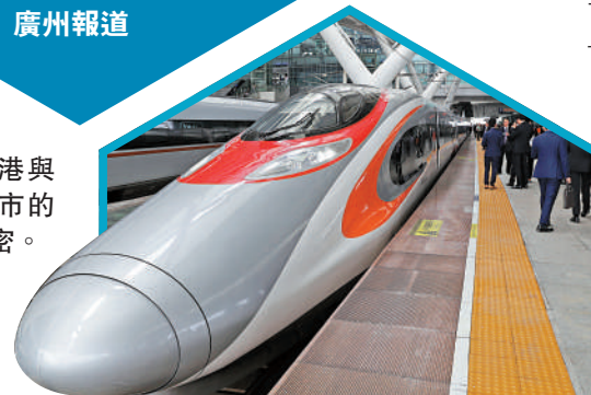
▶高鐵路令香港與大灣區內地城市的聯通更加緊密。資料圖片