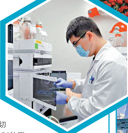
▲▼粵港雙方將以人才流動、培訓和教育、科技和創新應用，以及金融發展等作為重點合作領域。