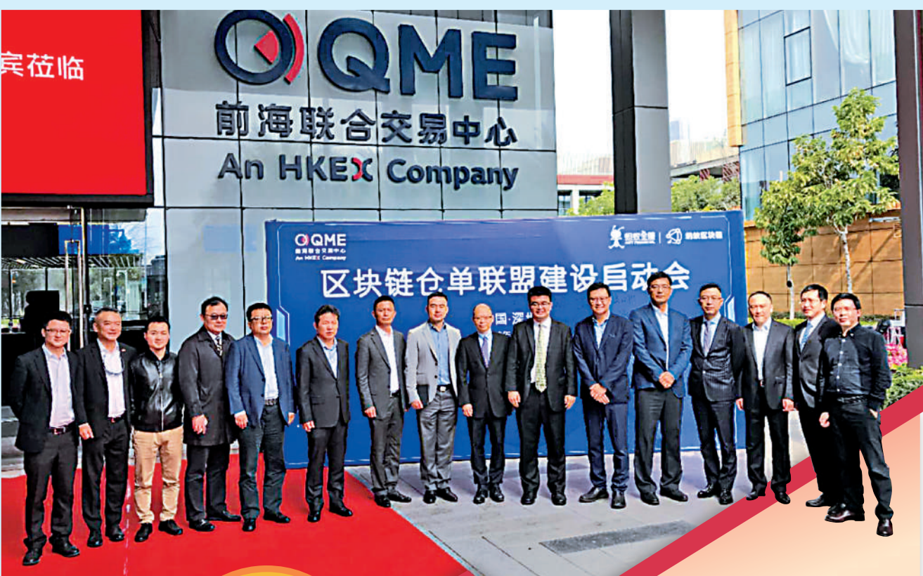
▲2020年1月，由香港交易所為主要發起人設立的前海聯合交易中心召開區塊鏈倉庫聯盟建設啟動會。