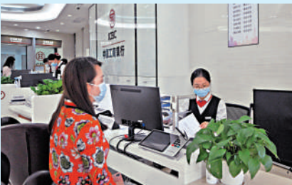
▲客戶在工商銀行深圳前海分行辦理跨境理財通業務。

余凌曲判斷，新政令前海在開展資本項目開放、推進人民幣國際化方面有了更加明確的國家政策支持，新政首次提出支持前海發展離岸金融業務，有利於前海更好打通與香港的跨