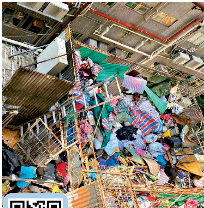
▲食環署昨日派出人員清理平台垃圾。