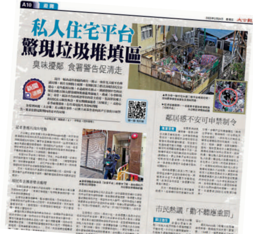
▲《大公報》昨日報道在長沙灣一幢住宅大廈的二樓，平台上堆滿了垃圾，引起廣泛關注。