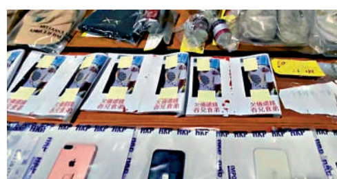
▲警方搗破一個非法收債的犯罪集團，拘捕十男一女。

以涉嫌企圖及串謀形式毀壞拘捕了4名14歲至17歲少年，其中一人已輟學，他們企圖到秀茂坪一個苑苑淋紅油追數，在他們身上發現紅油及收數紙等非法收數工具。