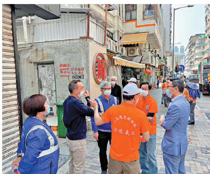
▲社區應急輔助隊到來義務協助，展開清理垃圾。