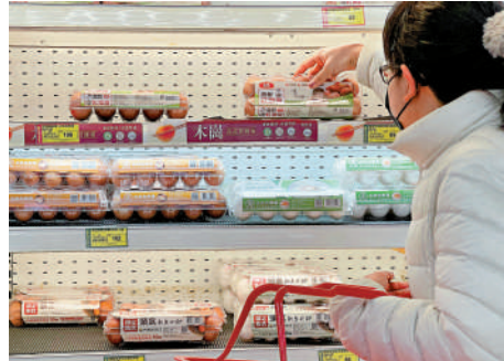
▲台北市信義區一家量販賣場內，民眾看着高昂的雞蛋價格猶豫不決。

因應「缺蛋」境況，台北市不少商店貼出限購雞蛋的告示，並不再售賣茶葉蛋、滷蛋等。阿盛介紹，2019年起，台灣每年春節過後都會出現「缺蛋」情形，蛋價也相應上漲，「成本上去了，但我不