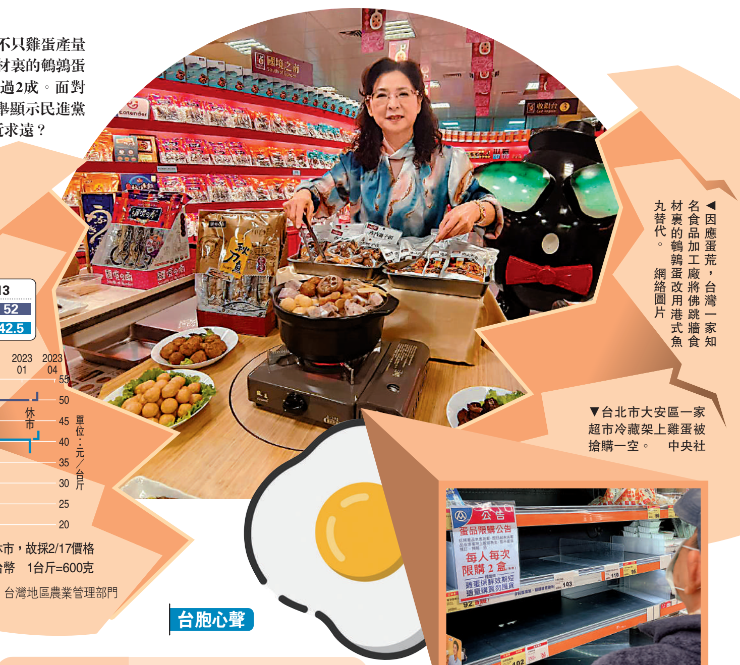
◀因應蛋荒，台灣一家知名食品加工廠將佛跳牆食材裏的鵝蛋改用港式魚丸替代。網絡圖片

去年國際能源價格大漲，台電發電成本上升，再加上為平穩物價吸收電價漲幅，虧損高達新台幣2675億元，今年預計再虧2785億元，兩年累計虧損逾5400億元。據此前報道，3月召開的電價費率審議會擬將電價上調超過30%，其中工商業首當其衝。 中通社