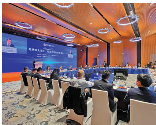
▲2月25日，由中國金融四十人論壇和中國金融四十人研究院聯合主辦的明珠灣金融峰會(2023)在廣州舉行。

人民幣金融中心。「香港和粵港澳大灣區可以成為國際、國內金融大循環的重要耦合點。香港作為活躍的離岸人民幣中心，將成為連接國內與國際市場的重要樞紐，通過進一步推動人民幣的使用和流通，可以助力推動人民幣的國際化進程。如果大部分粵港澳三個貨幣區之間的金融交易都使用人民幣作為中介，就可以大大降低貨幣錯配的風險。」另外，大灣區可以加強支撐數字人民幣走出去的新型基礎設施建設和頂層設計，並提供更多數字人民幣跨境支付應用場景的空間。