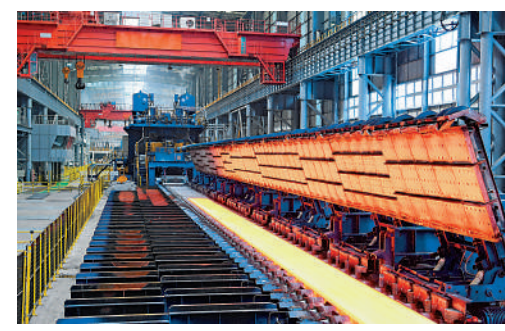
▲在河北省河鋼集團唐鋼公司，軋鋼車間有序運轉。

●2021年全年，原油、鐵礦石、銅、大豆等主要大宗商品貿易跨境人民幣收付金額合計為4054.69億元，同比增長42.8%。全年鎳、鈷、稀土等新能源金屬大宗商品貿易跨境人民幣收付金額合計1005.63億元，同比增長27.7%。