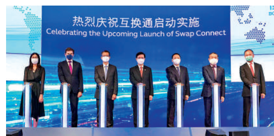
▲去年7月香港特區行政長官李家超（左四）出席債券通周年論壇暨互換通發布儀式。

●國際貨幣基金組織數據顯示，截至2022年一季度全球央行持有的人民幣儲備規模為3363.86億美元，人民幣在全球外匯儲備中佔比為2.88%，較2016年人民幣加入特別提款權(SDR)時提升1.80個百分點，在主要儲備貨幣中排名第五位。