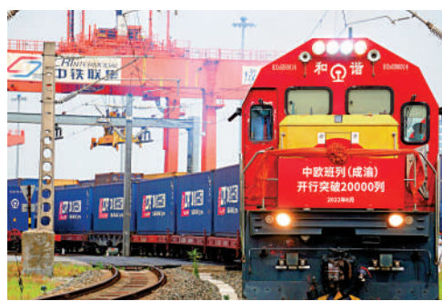
▲滿載貨物的中歐班列（成渝）駛出成都國際鐵路港。

●2021年，中國與「一帶一路」沿線國家人民幣跨境收付5.42萬億元，佔同期人民幣跨境收付總額的14.8%。截至2021年末，中國與22個「一帶一路」沿線國家簽署了雙邊本幣互換協議，在8個「一帶一路」沿線國家建立人民幣清算機制安排。