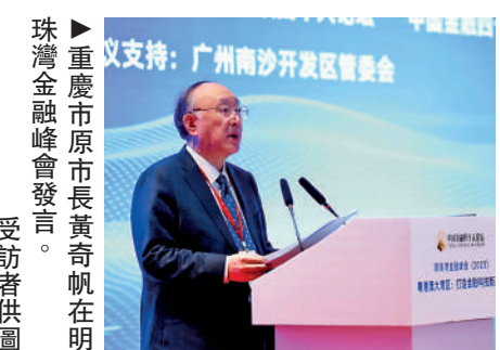
▲重慶市原市長黃奇帆在明珠灣金融峰會發言。

一方面，大灣區金融創新與實體經濟發展對接不足，金融發展和創新企業存在錯配。另一方面，區域內金融發展的不平衡和差異性突出，金融監管制度不易對接，市場成熟度差異較大。另外，粵港澳三地不同金融體系擁有不同的制度、法律、政策，創新資源、金融基礎設施等共享受制約。報告提到，數據打通和共享是跨境互通最大的障礙，大灣區可大力發展區塊鏈技術，協助打通不同地區的公安、司法、公證等信息，實現跨境數據核驗，助力跨境人才和交易流通；利用隱私計算技術，實現跨數據、跨行業的合作。