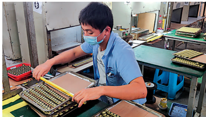
▲在尚寶公司生產線操作的緬籍員工。