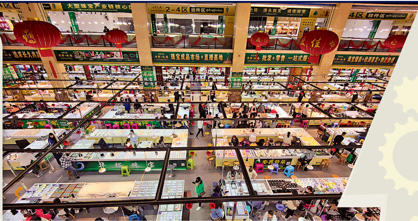
▲坐落於雲南瑞麗的多寶之城是內地首個標準化、規範化珠寶直播基地。

瑞麗因其毗鄰翡翠原產地緬甸的區位優勢，素有「東方珠寶城」美譽，業內更有「玉出雲南、玉從瑞麗」的說法。近年來興起的直播帶貨，也進入珠寶玉石行業，線上線下交易推動瑞麗珠寶玉石銷售風生水起。