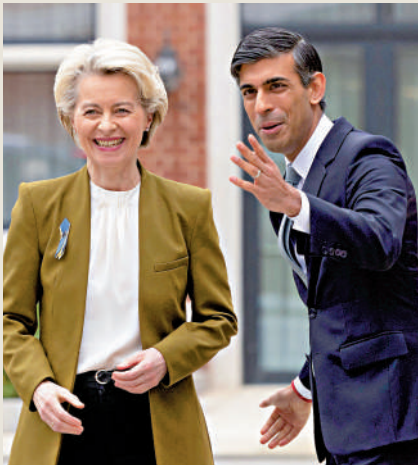
▲歐盟委員會主席馮德萊恩（左）27日會見英國首相蘇納克。

【大公報訊】綜合《金融時報》及路透社報道：英國27日與歐盟就脫歐後的北愛爾蘭貿易達成所謂「溫莎框架」協議，分析指英國首相蘇納克把籌碼壓在與歐盟建立更好的關係之上，這可能會在保守黨內引起強烈反對。