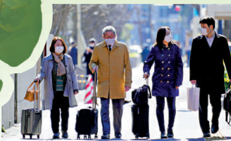
▼日本航空自衛隊女成員因遭性騷擾控告政府，圖為原告律師27日現身法院。