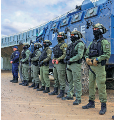
▲希臘邊防警察1月21日在隔離牆附近集結。

希臘總理米佐塔基斯上任後，一直對移民問題採取強硬態度。過去曾傳出希臘政府強行驅逐、阻攔邊境地區難民的消息，引發各界批判。