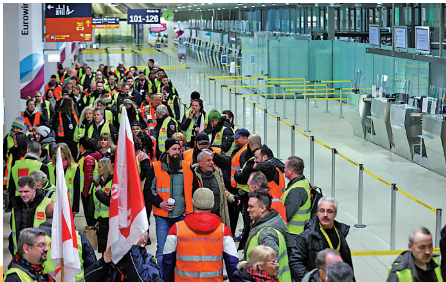
▲德國科隆一波恩機場的工作人員27日罷工示威，要求加薪。

【大公報訊】綜合彭博社、路透社報導：德國總理朔爾茨25日開始對印度展開訪問。他26日表示，德國政府考慮簡化印度IT專才在德國獲得工作簽證的程序，包括放寬語言要求以及讓專才更容易帶家人一同移居當地，以助緩解德國技術人才短缺。根據IT行業協會Bitkom的數據，德國目前有近14萬個IT職位空缺。