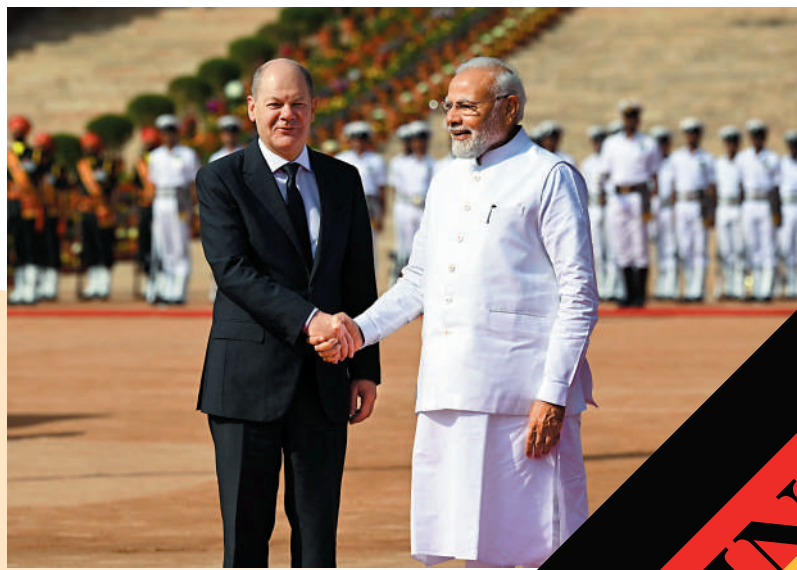
▲印度總理莫迪（右）25日與到訪的德國總理朔爾茨會晤。