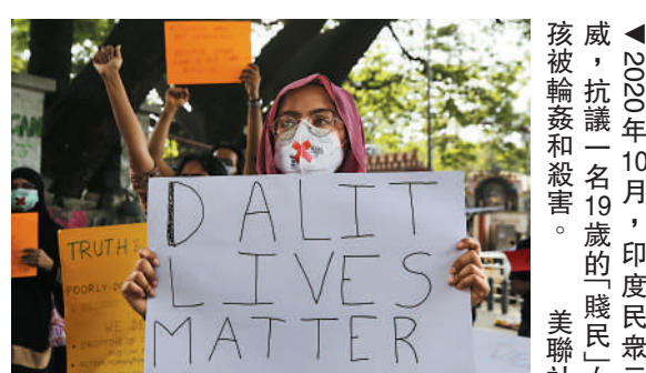
▲2020年10月，印度民衆示威，抗議一名19歲的賤民女孩被輪姦和殺害。

據《自然》雜誌統計數據顯示，印度頂尖教育機構中低種姓教員數量嚴重不足。被稱為印度高等教育神話的印度理工學院(IIT)中98%的教授，都屬於特權階層。