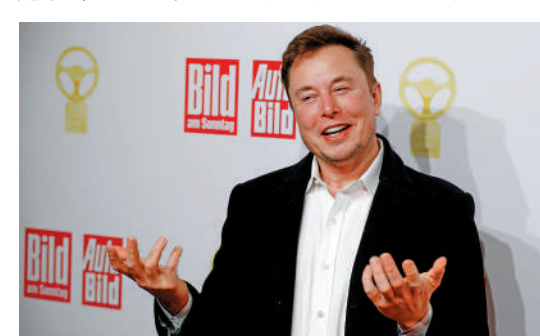
▲馬斯克去年10月入主推特後，已多次裁員。

出現大幅下滑。去年12月推特廣告收入按年下降近七成，這也推動了馬斯克開啟包括削減成本、發布新功能和調整內容審核政策等改革。為了維持推特運營並償還公司債務，馬斯克還拋售了Tesla的部分股份。2021年底以來，馬斯克累計出售了將近400億美元的Tesla股份。