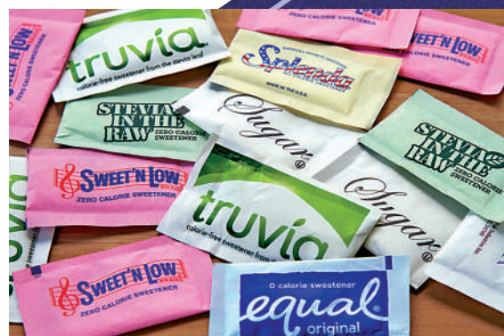
▲ 新研究指出，代糖可能與血栓、中風、心臟病等疾病相關。

美國國家猶太醫學中心心血管疾病專家弗利曼表示，赤藻糖醇目前已被廣泛使用，在更多研究結果出爐之前，建議避免食用。