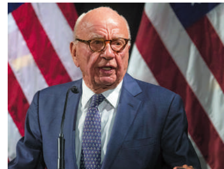
◀ 梅鐸承認霍士新聞名嘴散播不實信息。

Dominion在2021年3月提起訴訟，指控霍士集團及其相關人員為了收視與利潤，散播有關該公司投票機修改大選結果的謠言，並索償16億美元。霍士新聞一直否認在知情的情況下作出大選的錯誤言論，並稱這起訴訟的「核心在於言論自由和新聞自由。」