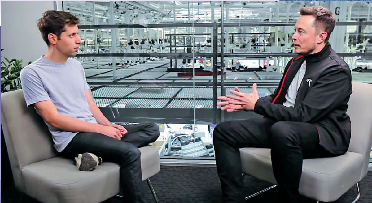
◀ 微軟員工2月7日展示與OpenAI整合後的必應搜索引擎。 ▶ 馬斯克（右）與OpenAI的行政總裁奧爾特曼。

【大公報訊】綜合The Information網站、彭博社報道：電動車巨頭Tesla創辦人馬斯克去年12月痛失全球首富寶座，輸給LVMH集團老闆、法國富豪阿爾諾。2月27日，因Tesla股價大漲，馬斯克重奪首富頭銜。與此同時，馬斯克繼公開批評近來大熱的AI聊天機器人ChatGPT後，亦有意親身下場加入戰局，開發ChatGPT的競品，據傳已經着手招兵買馬。