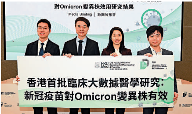
▲香港大學李嘉誠醫學院等研究數據證實，接種三針新冠疫苗對長者的保護力達九成以上。

研究發現，對於已接種三針疫苗的60歲或以上人士，疫苗對預防入院、嚴重併發症及死亡的效用均超過80%；而對80歲或以上人士預防死亡的效用更高達95%。建議長者