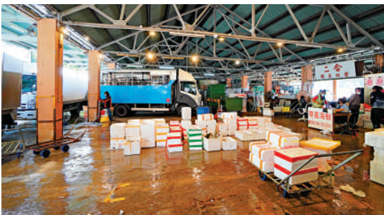
▲香港仔社區項目活動，在本月起舉辦香港仔魚市場導賞遊，讓公眾了解本港魚市場運作流程。

「漁港濃情·香港仔」社區項目於2021年9月展開，為期27個月。漁民文化博物館已於本年1月開放，為配合博物館的開放，主辦機構舉辦一連串公眾參與活動，除了香港仔魚市場導賞，亦包括漁港城市文化導賞遊、避風塘水上導賞等。