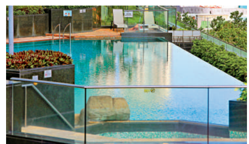
▲食環署現時沒有就持牌泳池發生的意外設立通報機制。

申訴專員公署表示，市民若有任何資料或意見，可於3月28日或之前以書面方式送達該署。