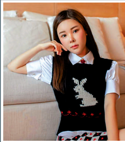
▲警方為尋找蔡天鳳殘肢，昨日派出百人打鼓嶺堆填區搜索。