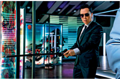
▲甄子丹在《殺神John Wick 4》中演殺手，造型是向他的偶像李小龍致敬。