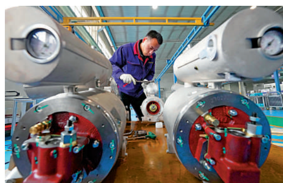
▲近年河北省元氏縣大力發展新能源汽車、機電設備等產業。圖為一家機電設備企業的工人在生產車間工作。新華社

郭衛民介紹，關於當前推動民營企業發展，有的委員建議，要進一步完善產權保護制度，落實公有制經濟財產權不可侵犯、非公有制經濟財產權同樣不可侵犯的產權保護制度。有的委員建議，發揮民營企業機靈活、創新力強、決策高效等優勢，在一些重點行業和領域，放寬民營企業的市場准入。有的委員建議，要對民營企業無事不擾制度，要創新金融服務民營企業模式，引導金融機構加大對小微企業支持力度，幫助中小微企業紓困解難。還有的委員提出，在國家層面建立企業家榮譽制度，表彰包括民營企業家在內的優秀企業家。委員們提出的不少建議都得到了政府主管部門的重視和採納。