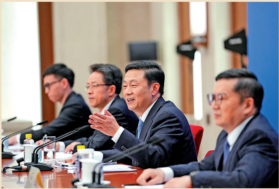
▲3月3日，全國政協十四屆一次會議新聞發布會在人民大會堂舉行，大會新聞發言人郭衛民向中外媒體介紹本次大會有關情況並回答記者提問。