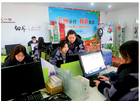
我國各地出台一系列政策舉措協助青年就業。圖為年輕人回鄉參加鄉村建設。

我國就業總量壓力確實比較大。穩就業仍然面臨不少困難和挑戰。但同時，今年穩定就業也面臨有利條件。我國經濟將持續恢復，將為穩就業提供堅實支撐。各地各部門出台的一系列政策舉措落地實施，也將為穩就業提供有力保障。