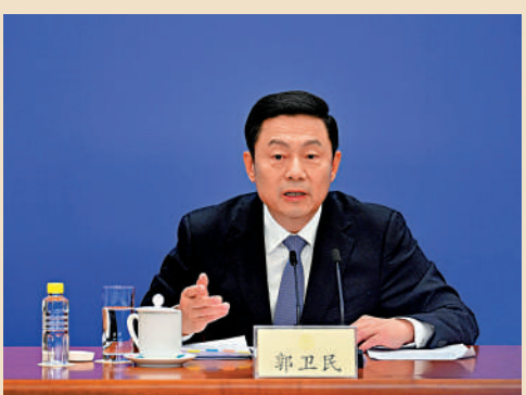
大會新聞發言人郭衛民向中外媒體介紹本次大會有關情況並回答記者提問。

郭衛民強調，就業問題關係到千家萬戶，是一項系統工程，需要政府、企業、相關機構和個人一起行動，社會各方共同努力促就業。全國政協將繼續把就業問題作為協商議政的一項重點工作，積極建言，凝聚共識，為穩定和促進就業貢獻力量。