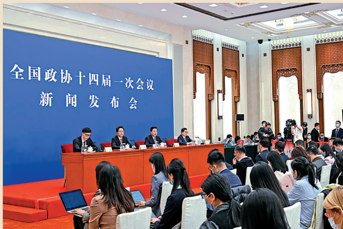
全國政協十四屆一次會議新聞發布會3日在北京人民大會堂舉行。