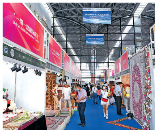
中國「一帶一路」建設取得豐碩成果。圖為去年9月在廣西南寧舉行的第19屆中國—東盟博覽會「一帶一路」國際展區。

郭衛民強調，國際上不時出現一些聲音，聲稱中國製造了「債務陷阱」，試圖抹黑共建「一帶一路」，抹黑中國形象。這種說法無中生有，沒有事實根據，是別有用心。這些雜音和噪音無法干擾、阻礙「一帶一路」建設。