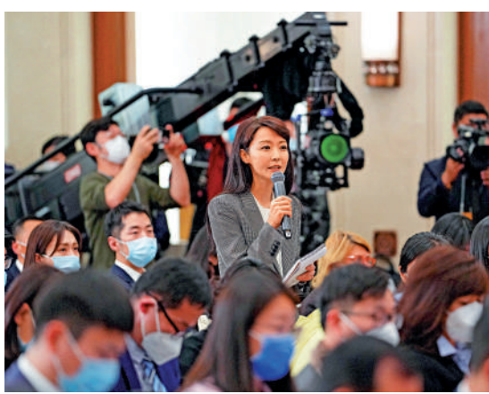
記者在全國政協十四屆一次會議新聞發布會上提問。

隨著大陸防疫措施的優化調整，兩岸民眾亦愈加期盼兩岸交流能夠「春暖花開」。今年以來，兩岸也開展了一系列的交流活動。對此，郭衛民表示，兩岸各領域的交流合作開展30多年，具有深厚基礎和內在動力，也是大勢所趨。全國政協秉持「兩岸一家親」理念，致力於促進兩岸同胞交流合作。