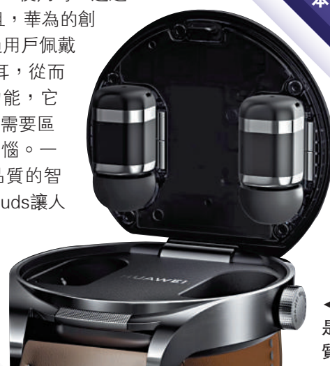
▲華為WatchBuds是一款兼具創意和品質的智能手錶。

但在iPhone 14 Pro正式發布之後很多用戶表示對於「靈動島」這一創新式的交互設計感到失望，一方面是由於早期軟體版本的適配問題，導致「靈動島」出現了大量的顯示BUG，另外一方面是因為「靈動島」並未如大眾預期中一樣帶來交互體驗的大幅升級。