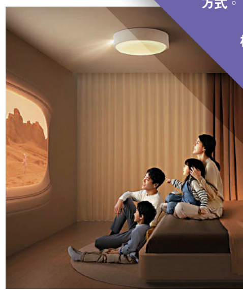
▼「極米神燈」將投影儀和房間的吸頂燈做了創新融合。

這樣的投影儀形態，讓人眼前一亮。不過，吸頂燈投影儀在安裝的時候對房間頂部布線等有一定的要求，購買前需要確認一下房間吸頂燈的位置是否適合安裝這樣的投影儀。