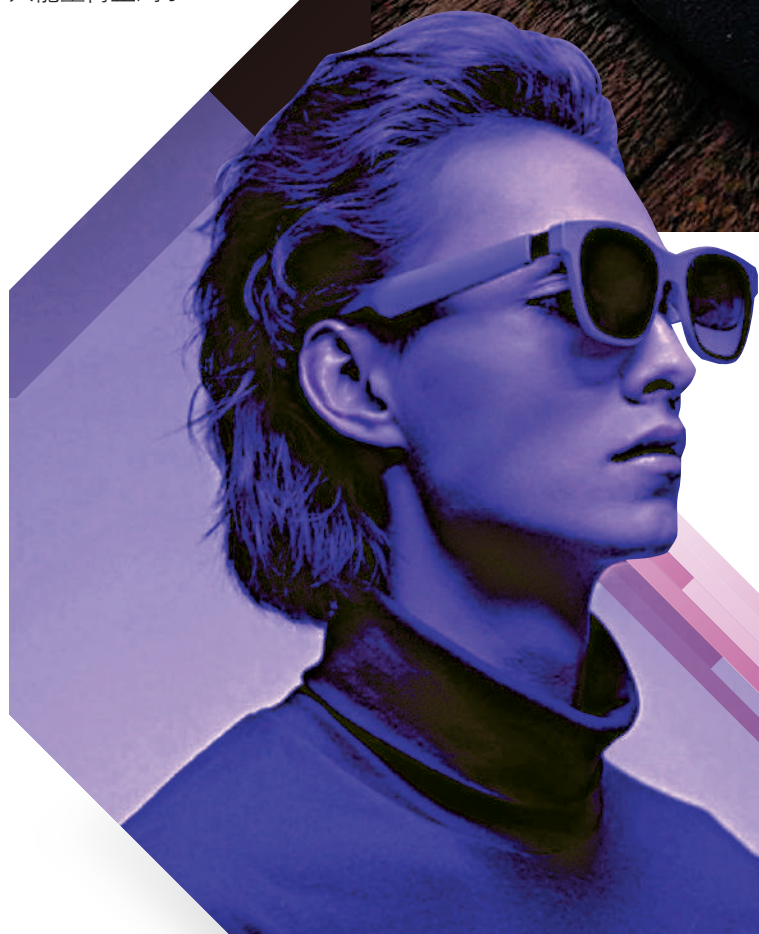
▲AR智能眼鏡Nreal Air外觀設計是目目前在售產品中最接近一般太陽鏡的一款。

但這款「概念版」手機目標並不是量產，更多的是一種技術上的探索。因此，其研發成本接近單台30萬元人民幣並不用於零售，我們一般消費者只能望梅止渴了。