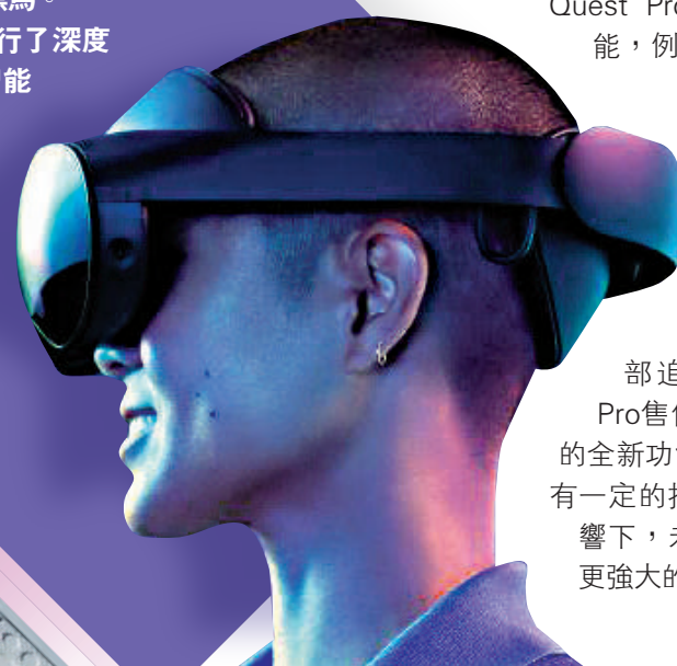
▲Meta推出高端VR頭顯Meta Quest Pro，以1500美元的價格發售。

作為Meta的首款高端頭顯設備，Quest Pro搭載了一系列全新功能，例如支持全彩MR體驗的高解析度感測器、高清LCD顯示幕是Quest2顯示像素的4倍、充滿科幻感的外觀設計、手寫筆附件，以及萬眾期待的眼動追蹤和面部追蹤功能。雖然Quest Pro售價並不親民，但它集成的全新功能卻是對未來行業趨勢有一定的指向作用的。在它的影響下，未來，我們將看到更多更強大的元宇宙設備出現。