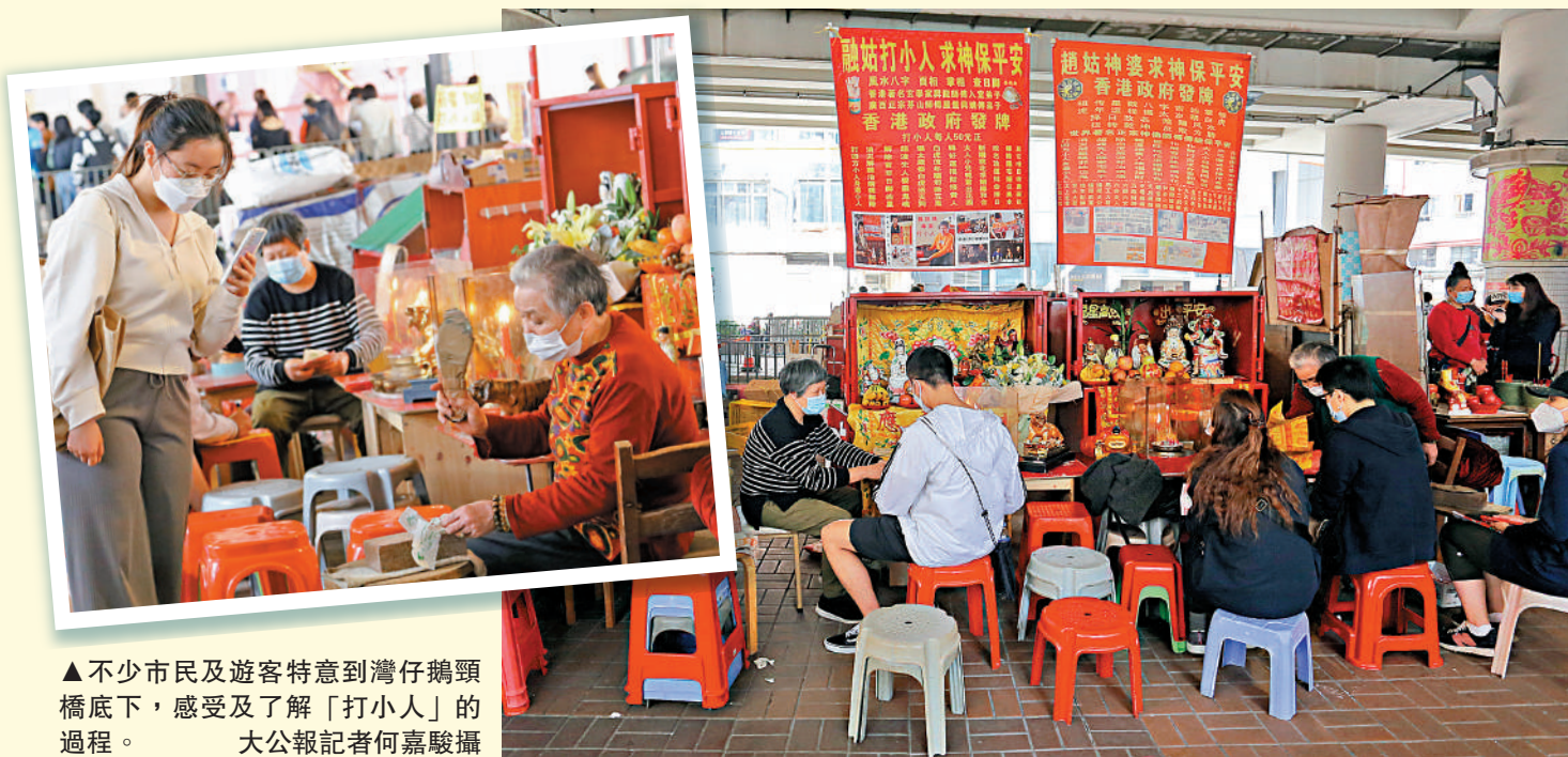
▲不少市民及遊客特意到灣仔鵝頸橋底下，感受及了解「打小人」的過程。大公報記者何嘉駿攝

▲明日是傳統節氣「驚蟄」，在灣仔鵝頸橋底下，出現人山人海的「打小人」盛況。大公報記者何嘉駿攝