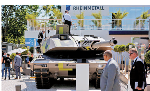
▲德國軍火商萊茵金屬擬在烏克蘭建坦克工廠，稱每年可以製造最多400輛「黑豹」主力坦克。

珀格認為烏克蘭需要600到800輛坦克，為達到上述目標，必須迅速開始製造新坦克。