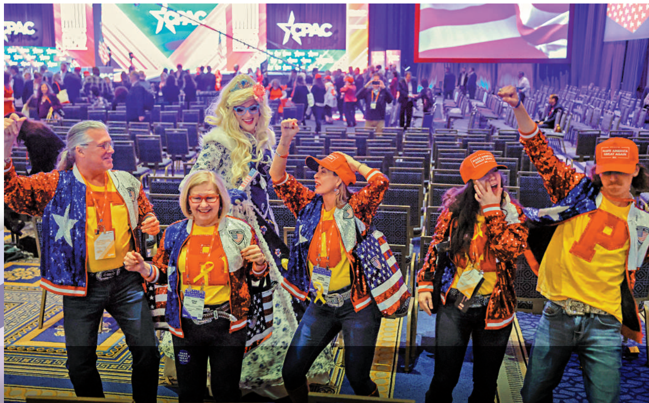
▲特朗普的支持者在CPAC會場合影。