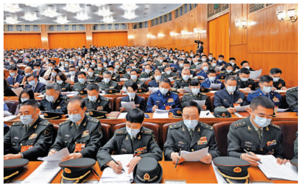
▲5日，代表們在認真聽會。