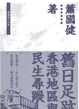
▲《舊日足跡：香港地區與民生尋蹤》，蕭國健著，三聯書店(香港)有限公司。