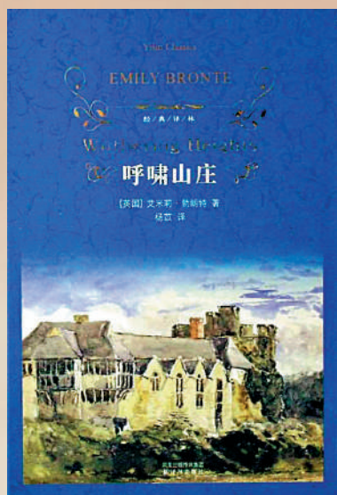
▲《呼嘯山莊》，艾米莉·勃朗特著，楊苡譯，譯林出版社。