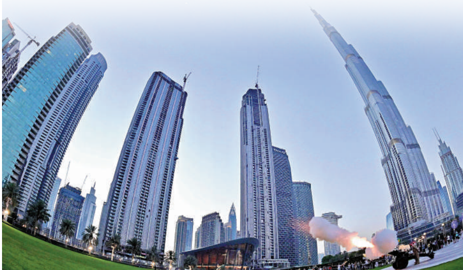
▲作為中東的金融體系，「伊斯蘭金融」特色鮮明。圖為迪拜市中心的哈利法塔等摩天建築。

同時，「伊斯蘭金融」禁止投機賭博，因為其不創造財富，是典型的零和博弈，助長社會不勞而獲的風氣；禁止收取利息，因這種行為不事生產，將貨幣視為商品，令部分採取「以錢生錢」模式的金融業務難以開展，如掉期交易和衍生品等；禁止具風險或不確定的商業交易，其中可能存在虛假信息、未充分披露等，導致不公平結果；禁止投資伊斯蘭教法禁止的行業，如豬肉、煙酒、軍火、賭博等。