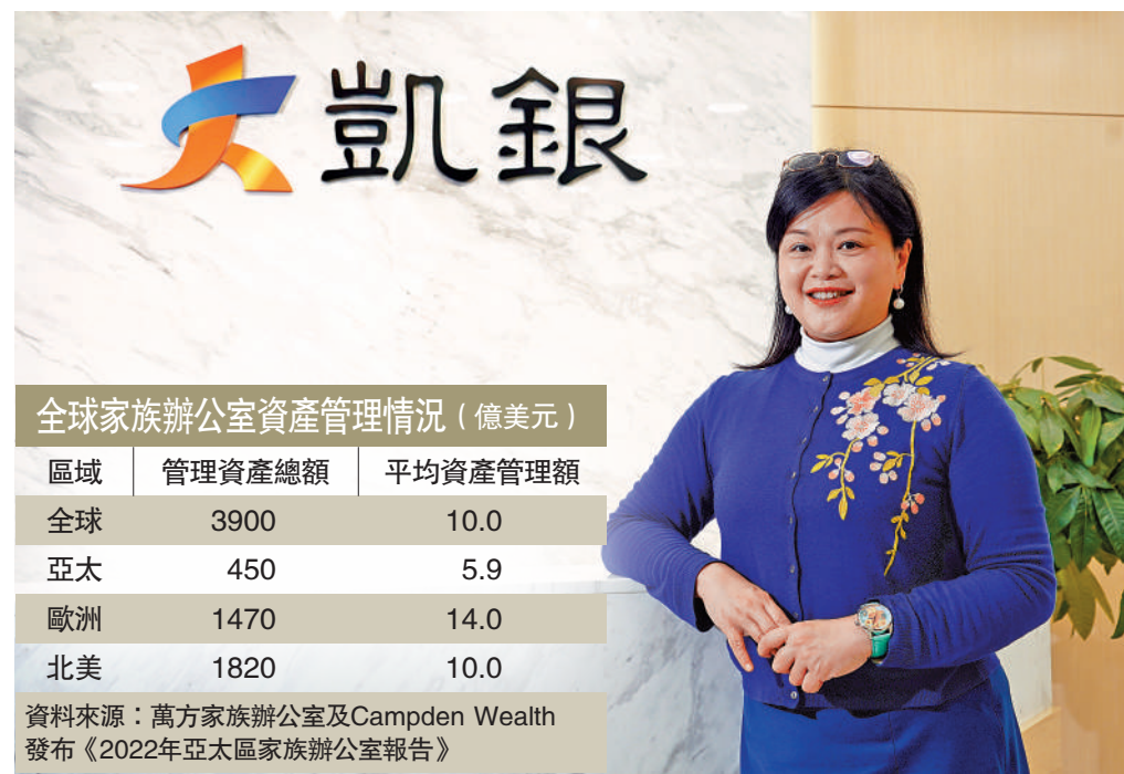
全球家族辦公室資產管理情況 (億美元)