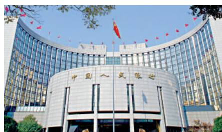
▲中金預計今年內地繼續保持流動性合理充裕，利率穩中略降。

財政政策方面，赤字率從2.8%上調到3%，專項地方債額度由3.65萬億元人民幣上調到3.8萬億元人民幣，均屬於溫和上調。中金預計，今年政府類債券淨增量小幅增加幾千億，力度溫和，供應壓力不大，不會對二級市場利率造成明顯影響。