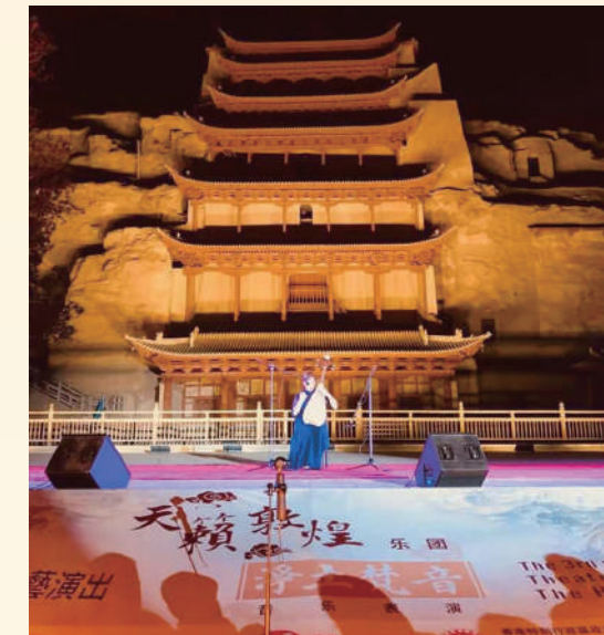
莫高窟前的「天籟敦煌」之音演出。

甘肅着力實施敦煌文化、長城文化、黃河文化、始祖文化、紅色文化、民族民俗文化六大工程建設，積極打造地方區域特色文化品牌，將省內長城遺址景點串聯打造成為國際長城文化旅遊風景廊道，加快建設黃河文化資源數據庫，加大花兒、環縣道情皮影戲等世界非物質文化遺產保護傳承，力爭建成全球華人尋根祭祖聖地和全球知名的華夏文化旅遊體驗目的地。