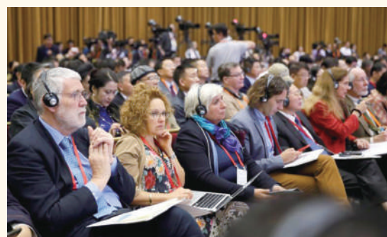
▲敦煌文博會中的外賓。

甘肅積極爭取政策，扶持有出口能力的文化企業和項目在服務貿易和服務外包領域開拓國際文化市場。甘肅企業錦繡實業有限公司、南特數碼、慶陽凌雲服飾集團有限公司、慶陽岐黃文化傳播有限公司入選國家文化出口重點企業，甘肅舞劇《絲路花雨》《大夢敦煌》入選國家文化出口重點企業和重點項目。慶陽香包、華源紐約東