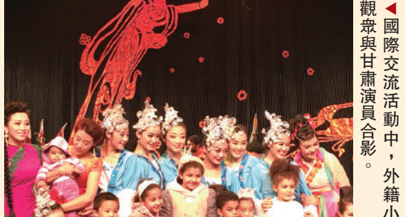
國際交流活動中，外籍觀眾與甘肅演員合影。