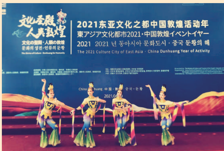
▲2021東亞文化之都中國敦煌活動年文藝演出。