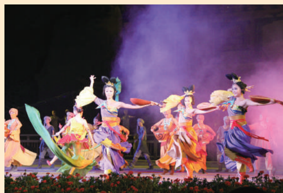
▲甘肅經典舞劇《絲路花雨》劇照。