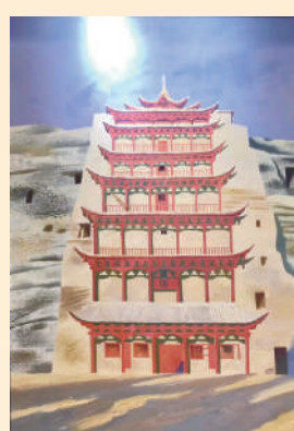
▲俄羅斯畫家作品——莫高窟。

將文化貿易與文化交流相結合，推動甘肅華源集團參加第38屆紐約藝術博覽會舉辦「千年的敘述——中國絲綢之路藝術精品展」，展出甘肅特色文化產品600餘件套。