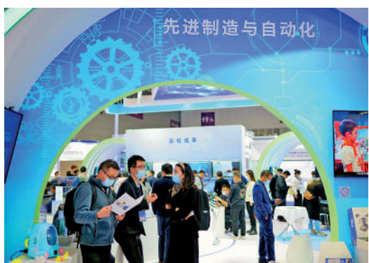
▲2021年，深圳高交會上，先進製造與自動化展區吸引參觀者。