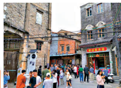
▲在電視劇《狂飆》的熱播帶動下，大批遊客來江門打卡。

粵港澳大灣區以嶺南文化作為核心文化，具有同根同源、人緣相親的天然優勢，為大灣區文旅聯合發展奠定基礎。正如最近熱度很高的網紅城市江門，一直有與香港旅