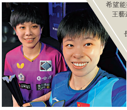
▶王藝迪(右)與鄭怡靜自拍照。