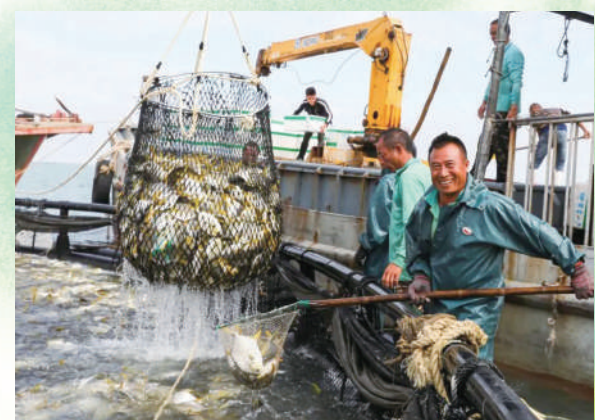
▲金鯧魚豐收。

立足產業基礎，搶抓產業風口。《關於做好2023年全面推進鄉村振興重點工作的意見》中央一號文件，首次將預製菜寫入其中，提出培育發展預製菜產業。一直以來，湛江憑借水產養殖優勢，發力預製菜行業，培育了恆興集團、國聯水產等預製菜龍頭企業，不斷延伸產業鏈條。2022年，通過拓展「粵菜師傅+預製菜全產業鏈」發展模式，進一步推動預製菜產業高質量發展，獲評「中國預製菜之都」。