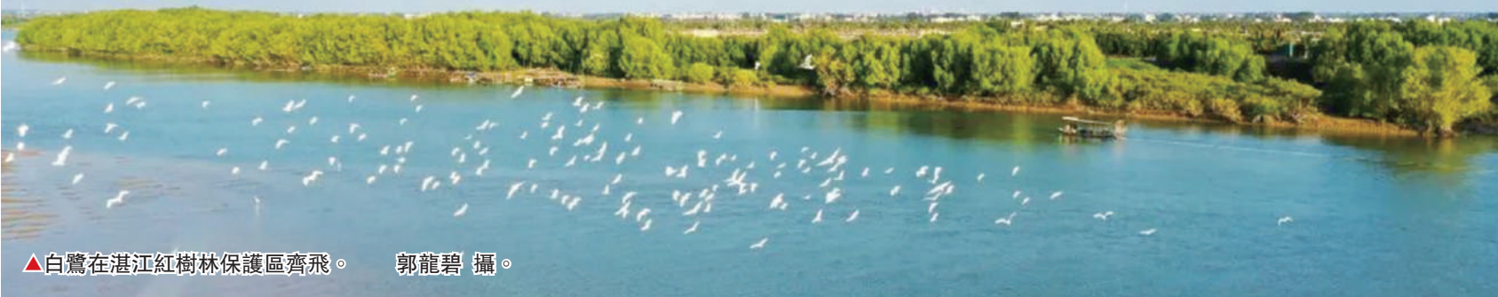
▲白鷺在湛江紅樹林保護區齊飛。

東風浩蕩滿眼春，萬里征程催人急。新的一年，湛江已經在把握歷史主動，鑄定高質量發展這一首要任務，堅持工業化、生態化、數字化深度融合理念，聚焦加快大園區建設、推進大文旅開發、深化大數據應用等重點工作，堅持製造業當家，加快建設巴斯夫、廉江核電等重大項目，積極發揮寶鋼湛江、中科煉化等龍頭企業的帶動作用，全力打造綠色鋼鐵、綠色石化、綠色能源三大世界級產業集群，奮力推動實現高質量、跨越式發展！