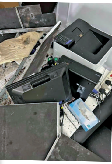
▲跌下的石屎，壓毀打印機和電腦等設施。