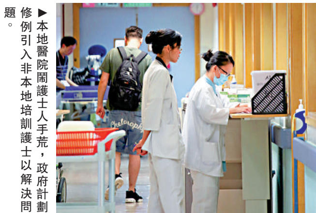
修例引入非本地培訓護士人手，政府計劃題。