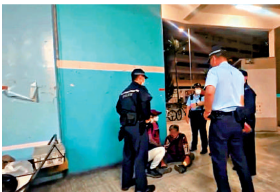
▲最近網上流傳一段食環署執法的影片，涉及一名持牌的親友代為「睇檔」。

據《香港貧窮情況報告》，貧窮長者數字為近10年新高。樂施會發言人表示，希望政府加強基層勞動者退休後的保障，包括醫療、退休金及基本居住需要，減少長者晚年仍要工作的情况。