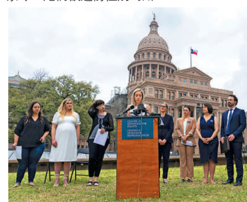
▲提告的得州婦女7日在州議會前見記者。