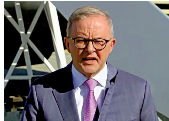
▲澳洲總理阿爾巴尼斯。