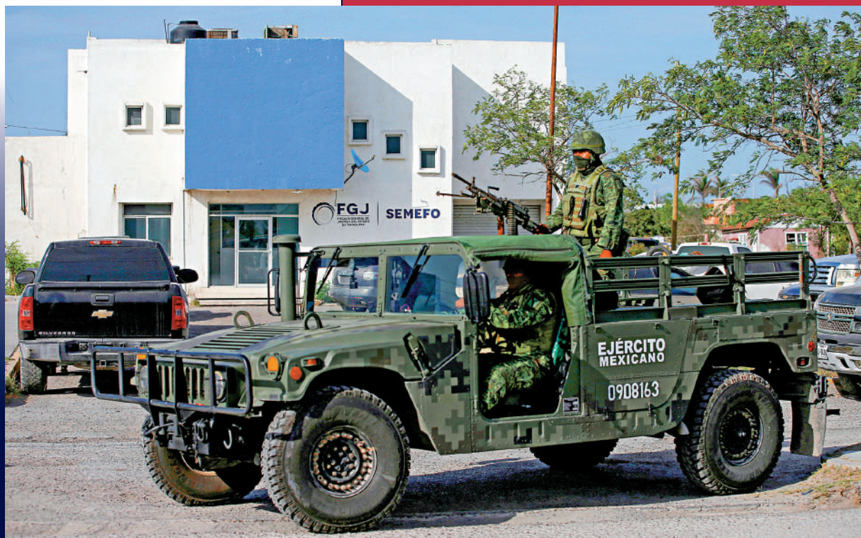
▲墨西哥士兵7日在馬塔莫羅斯法醫署停屍房外戒備。