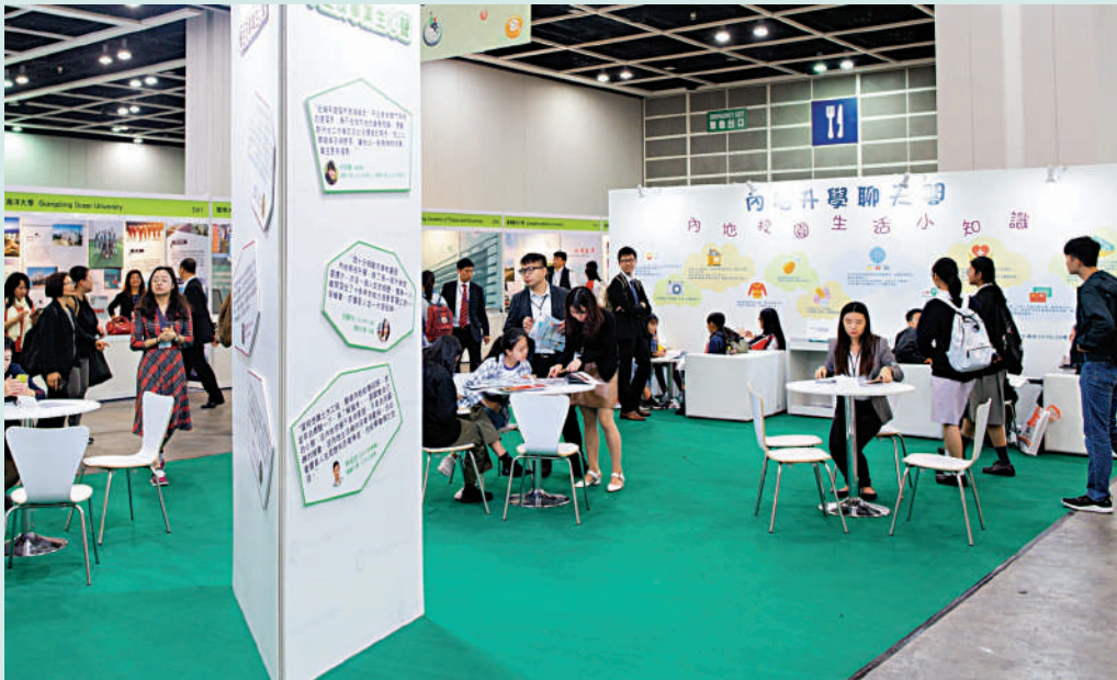
▲香港學生可透過多個途徑報考內地大學。圖為疫情前香港學生參觀升學教育展，了解到內地升學的詳情。資料圖片

羅永祥表示，目前聯考的涵蓋學校已達300多間，而每間學校開放取錄的專業亦是最多。他以同樣在內地高校招收香港中學文憑考試學生計劃中亦有涵蓋的中國傳媒大學為例，眾所周知，該校的導播類科目最出名，不過在面試錄取的聯招及文憑試生取錄上，這些專業是不開放的。因此，學生如心儀特定學校的某些專業，一定要事前做好相關資料搜集。