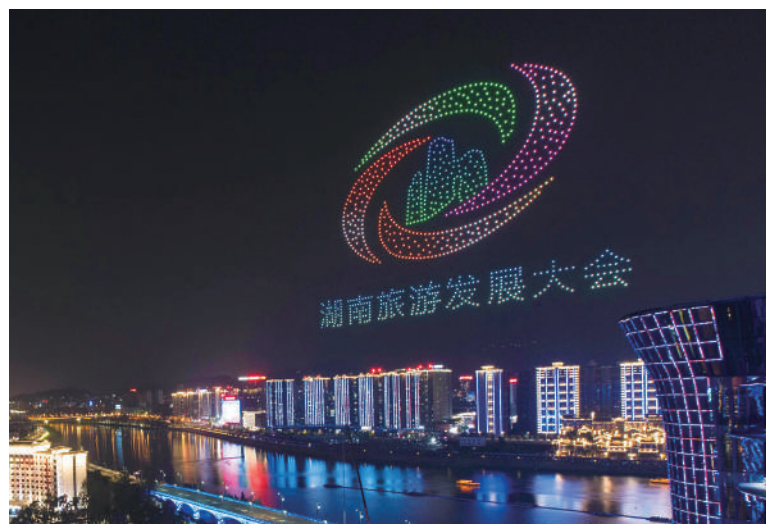
▲首屆湖南旅遊發展大會在張家界舉辦。

遊客1,567.58萬人次，同比2022年增長71.33%，高於全國增幅48.2個百分點，同比2019年增長1.53%；全省實現旅遊綜合收入159.88億元，同比2022年增長66.45%，增幅高於全國36.4個百分點，同比2019年增長5.05%。