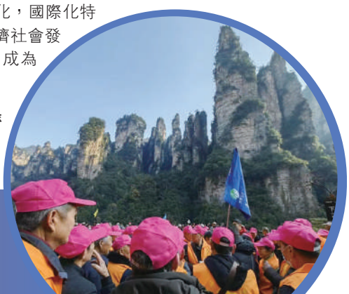
▶張家界景區重新擠滿了來自全國各地的遊客。

根據湖南省委、省政府出台的《關於加快建設世界旅遊目的地的意見》，到2025年，湖南旅遊總收入將達到1.1萬億元以上，接待遊客7.5億人次以上，初步形成具有全球吸引力的旅遊產品體系，到2035年，湖南旅遊產業生態更加優化，國際化特徵更加凸顯，對全省經濟社會發展推動作用更加有力，成為世界旅遊目的地。