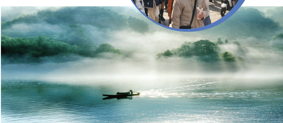
▲第二屆湖南旅遊發展大會將由郴州承辦。圖為郴州小東江景區。

遲日江山麗，春風花草香。湖南文旅產業正以長沙為龍頭與引擎，迎來了桃紅柳綠、希望無限的春天。