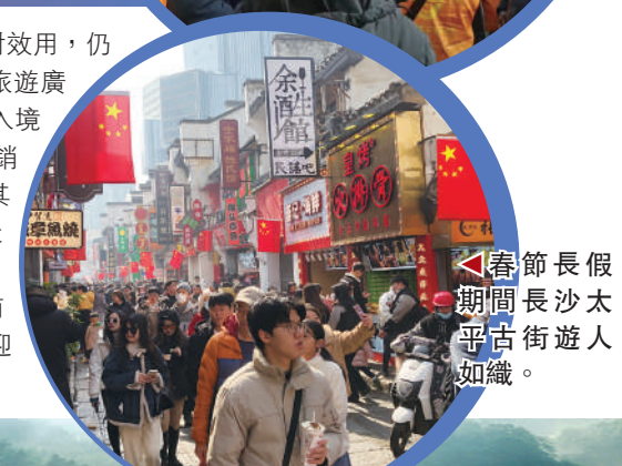
▶春節長假期間長沙太平古街遊人如織。