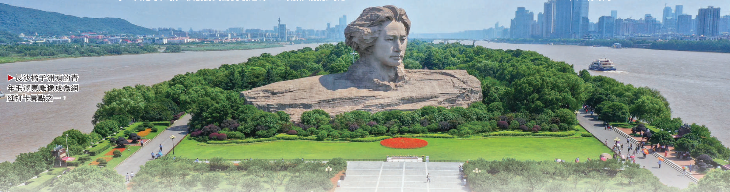
▶長沙橘子洲頭的青年毛澤東雕像成為網紅打卡景點之一。