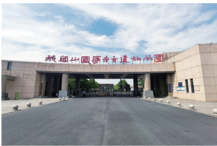
▲湖南城頭山國家考古遺址公園。

「五張名片」的提出，既是湖南省穩經濟、轉動能、促消費的戰略選擇，也是增強湖南旅遊美譽度，塑造湖南對外開放新形象的重要路徑，必將成為放大湖南省旅遊資源優勢、加快旅遊業轉型升級、實現文化旅游產業高質量發展的核心引擎。