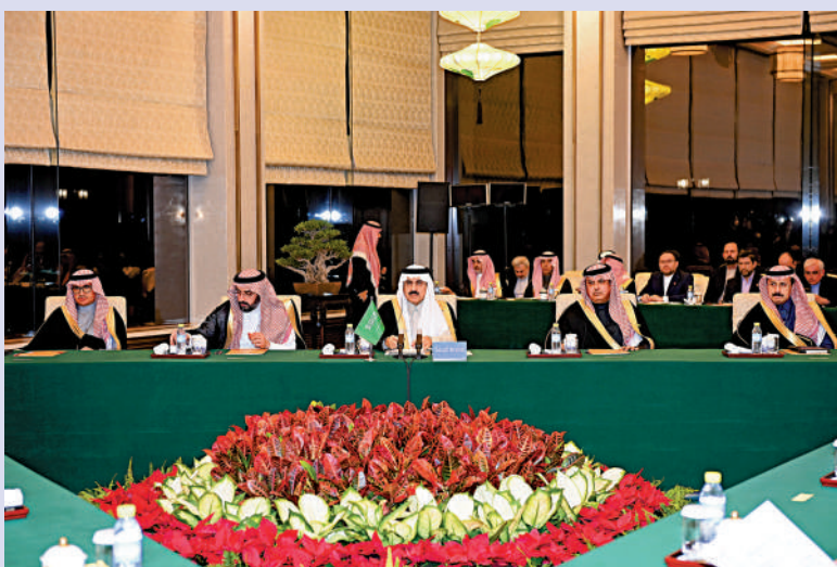
三▶ 沙特國務大臣兼國家安全顧問艾班（前排左）10日出席對話閉幕式。