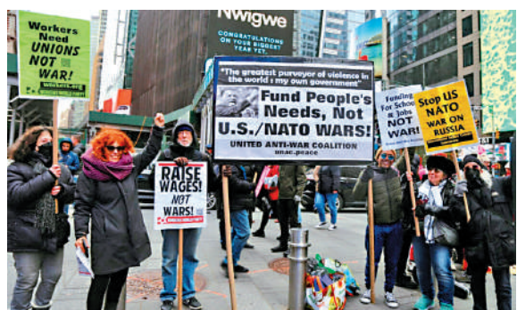
▲美國民眾在紐約時報廣場示威，反對政府繼續支持烏克蘭戰爭。

美國財政部9日將5家中國企業和1名個人列入制裁名單，稱其向伊朗無人機製造商供應零部件。中方10日對此表示堅決反對，敦促美方立即糾正錯誤做法，停止對中國企業和個人的無理打壓。