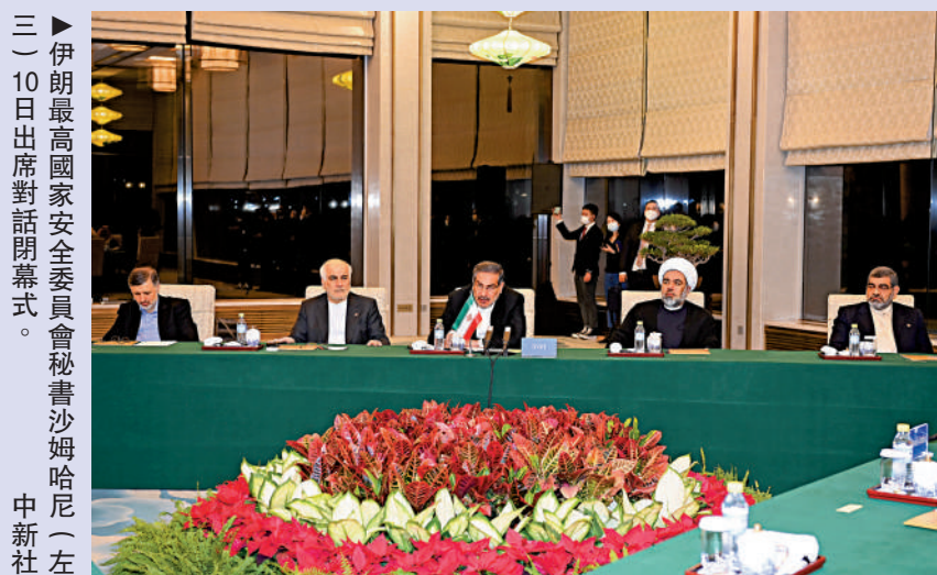
三▶ 伊朗最高國家安全委員會秘書沙姆哈尼（左）10日出席對話閉幕式。