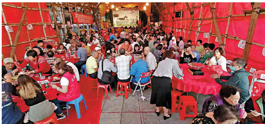
▲古洞村盆菜宴現場。