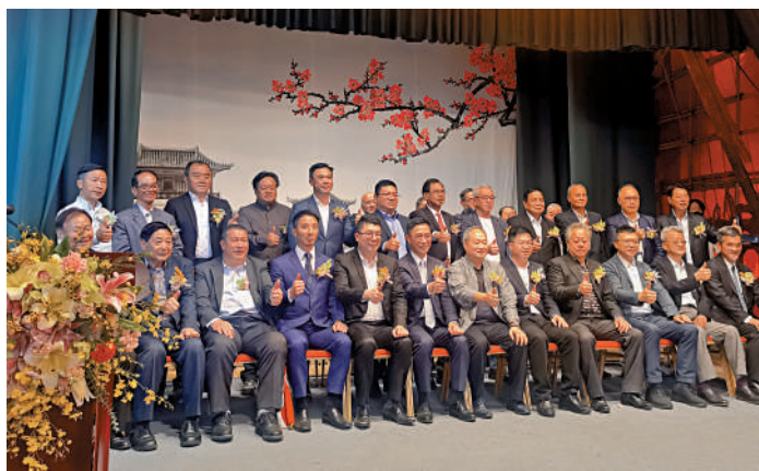
▲眾嘉賓出席慶祝古洞村觀音寶誕酬神演戲委員會成立70周年慶典儀式。