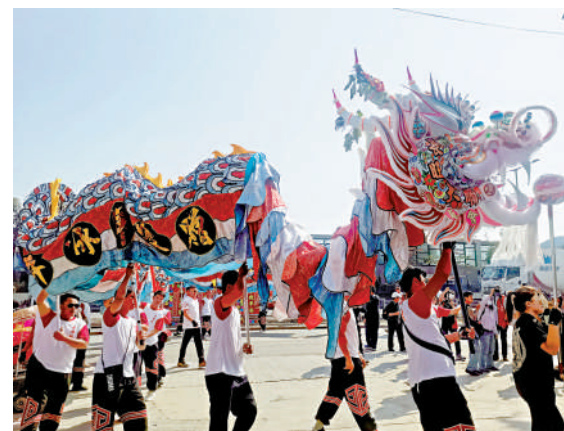
▲古洞村眾人舞龍場面。

從1953年至1983年，上水古洞村「觀音寶誕酬神演戲委員會」每年都會在觀音誕酬神演戲，舉辦觀音誕神功戲，除了任劍輝、白雪仙外，香港粵劇藝術家，諸如白玉堂、梁醒波、麥炳榮、鳳凰女、任冰兒、關海山、李寶瑩、龍劍笙、梅雪詩等都曾到古洞村演出神功戲。1983年之後停辦至去年，今年復辦。