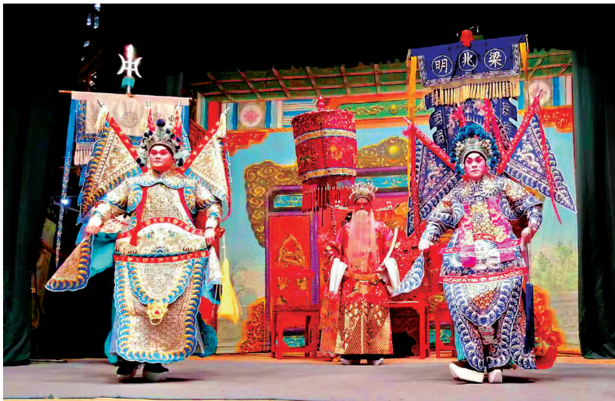
▲金龍鳳劇團上演神功戲《六國大封相》。