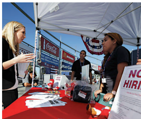
▲美國2月份新增職位錄得31.1萬份，較市場預期多。