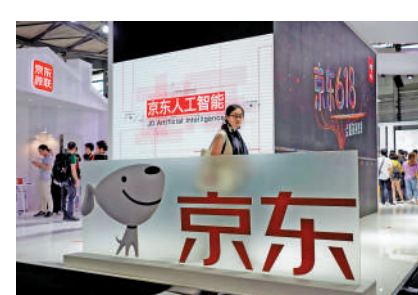
▲券商擔憂京東的商品交易額增長可能轉弱。