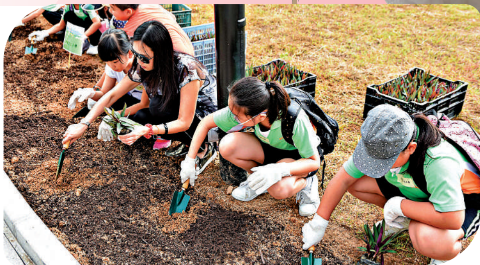
▲近年本港滿城花開，政府的貢獻很大。多個部門在各區種植，並舉辦活動讓市民一同參與，美化社區。圖為學生義工參與社區種植日。

車輪梅、禾雀花、宮粉羊蹄甲、白花羊蹄甲、黃花風鈴木、紅花風鈴木、紅棉、緋寒櫻、簕杜鵑花、杜鵑花、映山紅、藍花楹、白千層、雞蛋花、樹頭菜、銀珠。