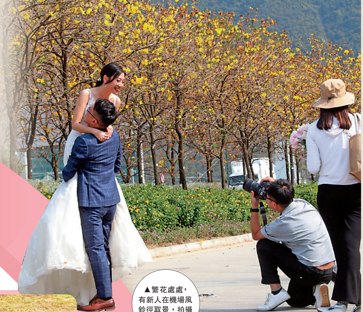
▲繁花處處，有新人任機場風鈴徑取景，拍攝婚紗照。