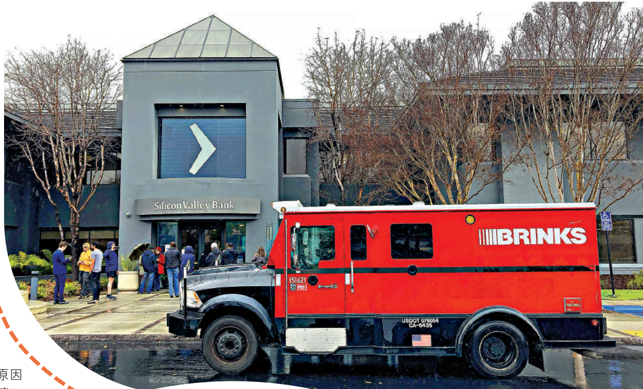
▶美國硅谷銀行位於加州聖克拉拉縣的總部外，10日有多人在門外等候消息。

成立於1983年的硅谷銀行是排名前20的銀行，主要服務於科技企業，也是硅谷眾多初創公司的金主，Facebook、推特等知名企業都曾是其客戶。截至2022年底，硅谷銀行的資產規模達2090億美元（約1.64萬億港幣），存款規模為1754億美元（約1.38萬億港幣）。