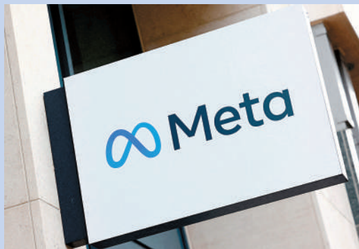
▲Meta被爆下周宣布新一輪裁員，預計影響1.1萬人。

媒體平台服務，可能會類似推特（Twitter）。Meta發言人稱，「我們正在努力創建一個去中心化的社交媒體平台，任何人都可以分享自己的想法。」但暫時未知新產品何時推出。有分析稱，Twitter在馬斯克入主後問題頻頻，促使Meta考慮推出取代Twitter的產品。